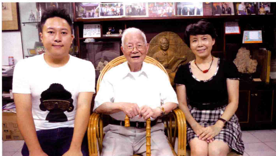
图2 国医大师邓铁涛教授接受第二届国际经方班视频演讲录像