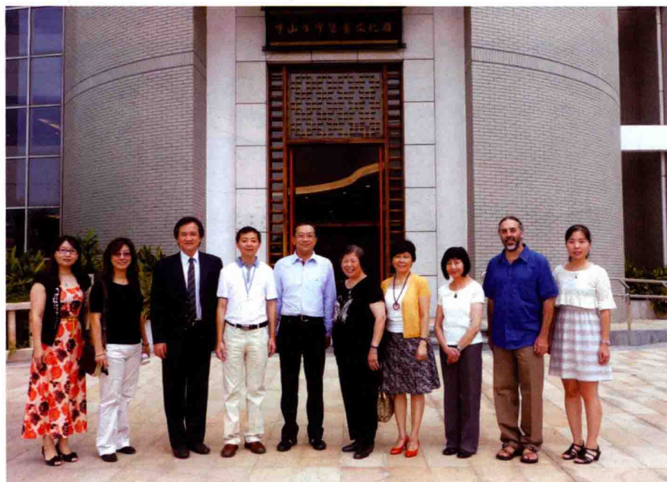
图8 部分海内外专家合影(一)