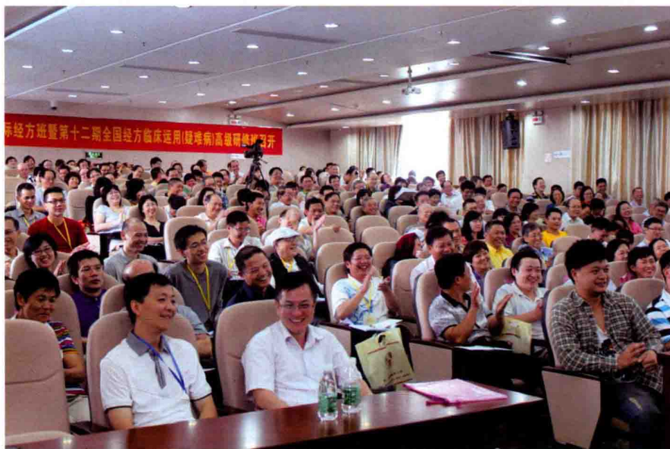
图10 学员会场认真听课，掌声不断