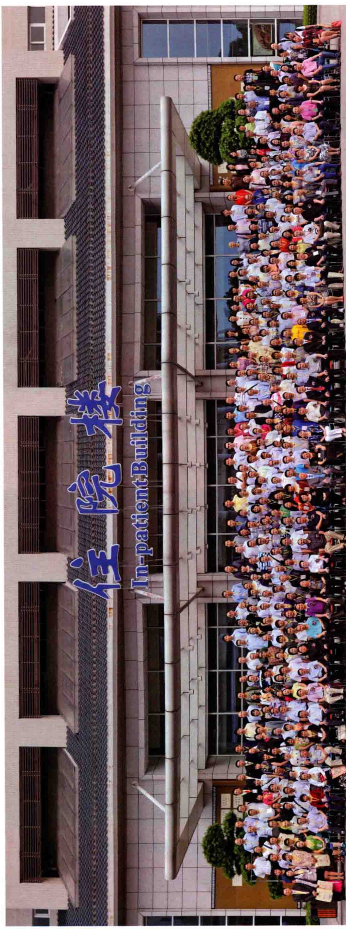
第十二届国际经方班暨第十二届全国经方临床运用（疑难病）高级研修班 中山 2012.09.21-24