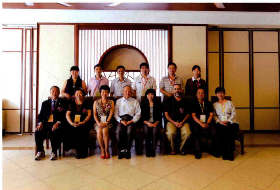
图 5 国医大师郭子光教授与部分专家合影