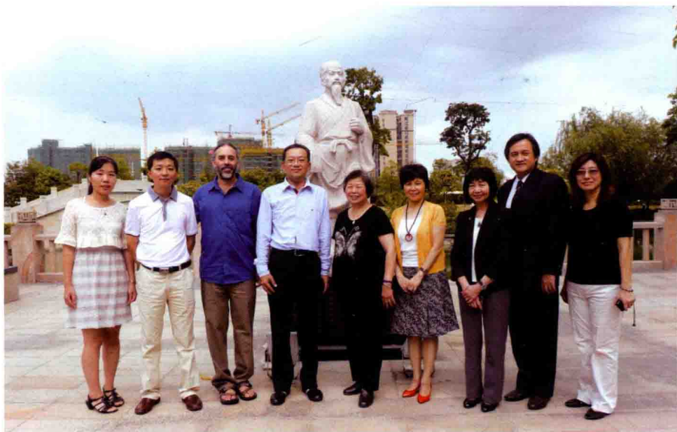
图9 部分海内外专家合影（二）