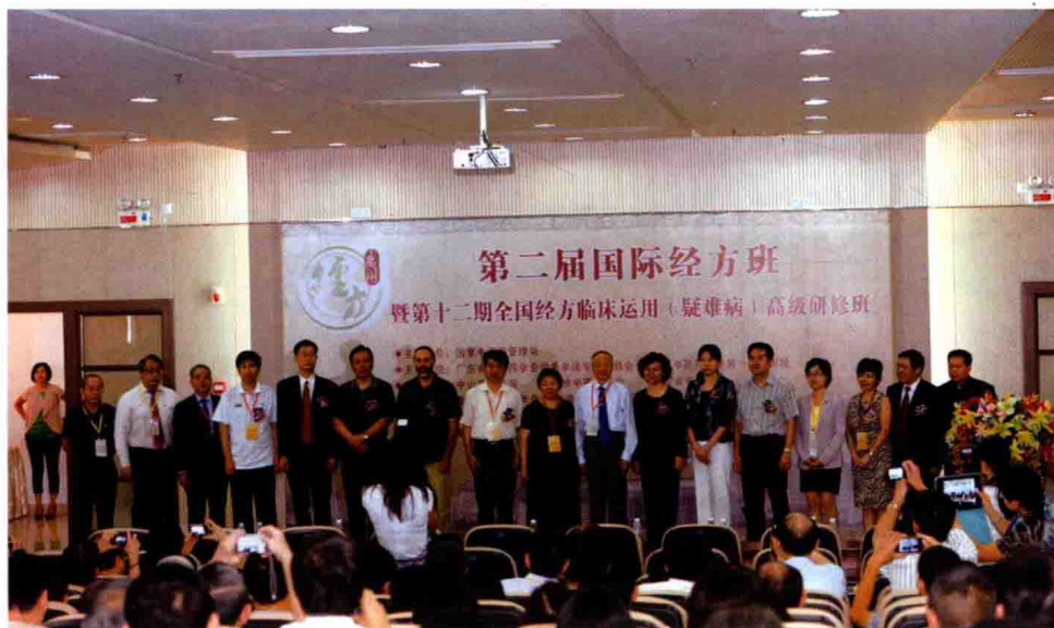
图7 第二届国际经方班专家、嘉宾合影