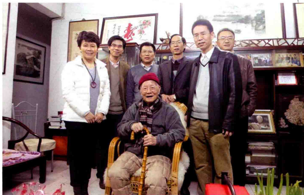
图 4 2012 年春节经典临床研究所成员看望国医大师邓铁涛教授