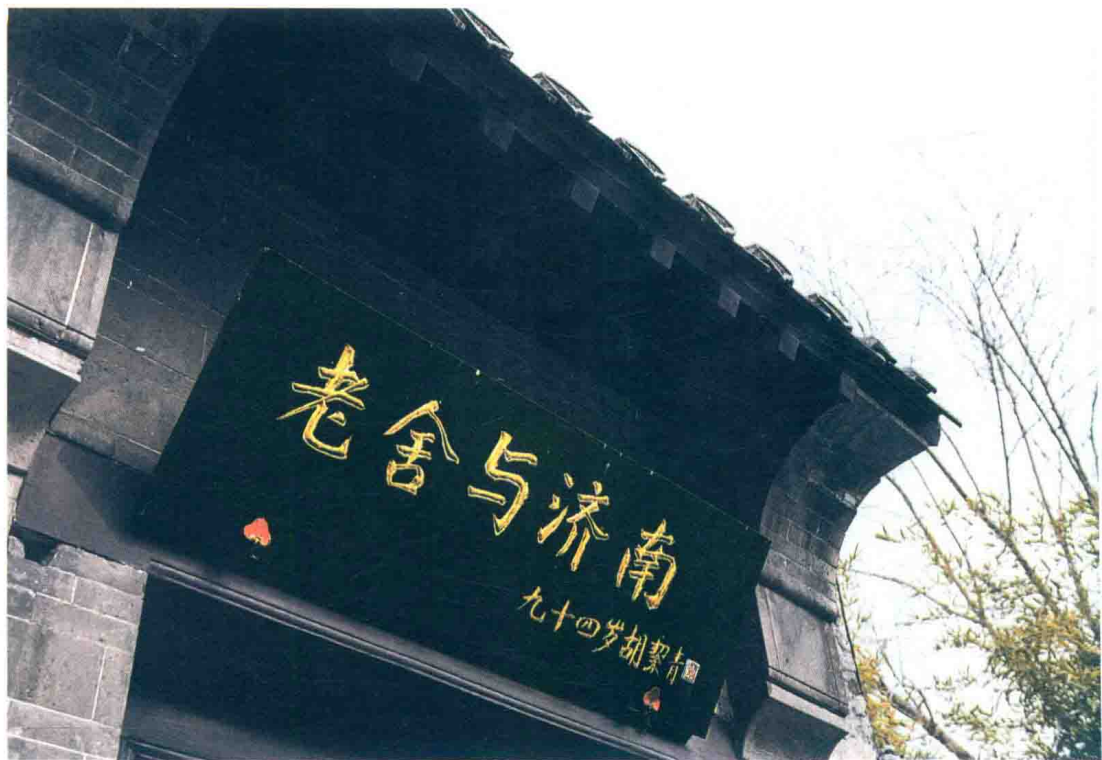
位于大明湖南岸的老舍纪念馆