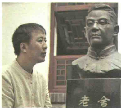
魏新，文化学者，全国青联常委， 央视《百家讲坛》主讲人。