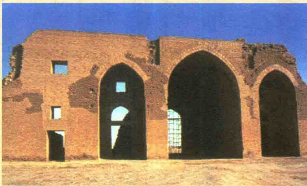
↑ 穆阿泰西姆宫残壁

了保护自己的安全，哈里发让自己的卫队也住进宫内，并挖了一条哈里发宫与禁宫之间的地道。在如此严密的保护下，阿拔斯王朝的统治者终于可以暂时忘却权力斗争的生死相搏、尔虞我诈，获得期望中的安逸生活。