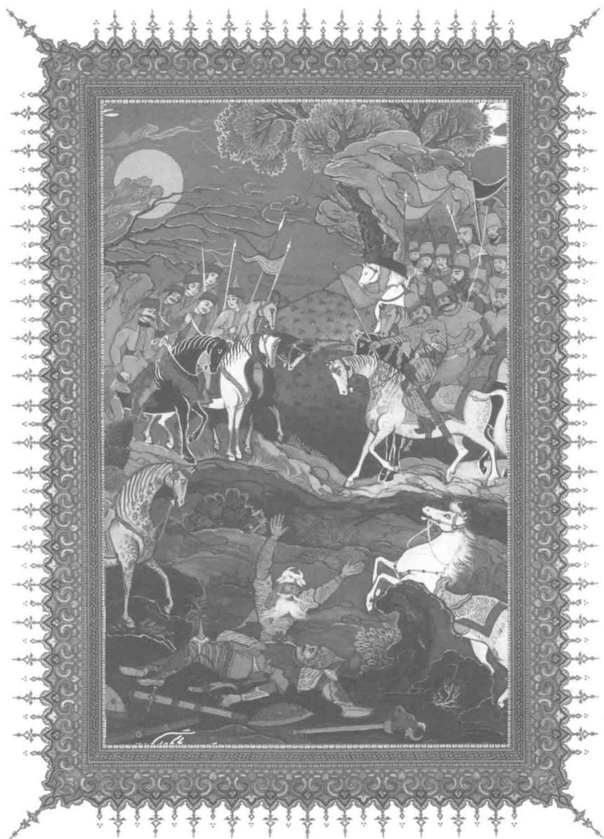
▲ 苏赫拉布惨死于鲁斯塔姆手下