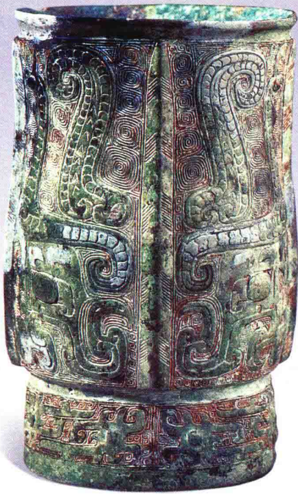
彩图 5 - 1 器外底带龙形图像 (图像铭文)与“父”字的青铜觶 商代晚期 高14.72厘米,口径8.25厘米,底 部直径7.13厘米 美国圣路易斯艺术博物馆藏 (正文第203页)