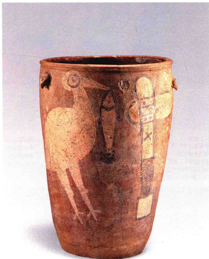
彩图 3 - 23 鹤鱼石斧图陶缸 (瓮棺) 仰韶文化 高 47 厘米 河南临汝阎村出土 (正文第 082 - 083 页)