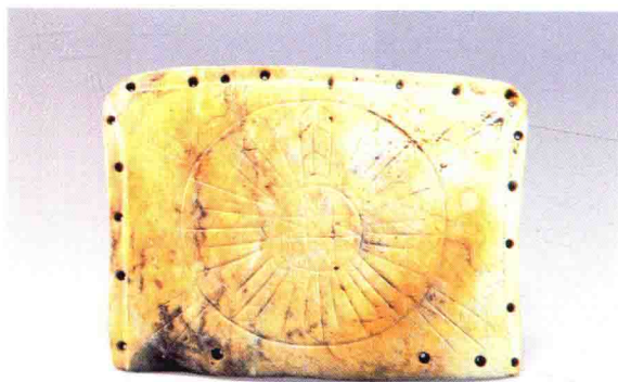
彩图 3 - 148 玉龟与玉版 凌家滩文化 龟长 9.4 厘米，玉版长 11 厘米 安徽含山凌家滩出土 (正文第 131 页)