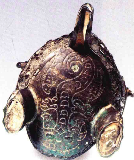
彩图 5 - 17 器外底带动物形图像的虎噬人形青铜卣 商代晚期 高 35.3 厘米 法国巴黎塞努齐亚洲艺术博物馆藏 (正文第 213 - 214 页)