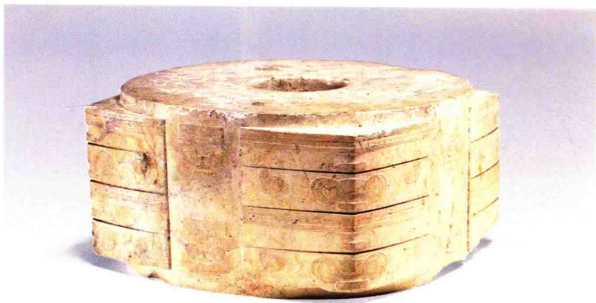
彩图 3 - 145 神人兽面图案玉琮 良渚文化 高 8.9 厘米 浙江余杭反山出土 (正文第 129 - 130 页)