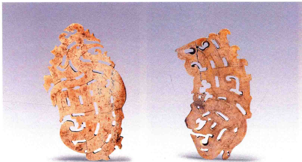
彩图 3 - 85 玉凤与玉龙 湖南龙山文化 凤.高 12.6 厘米 龙.高 9.1 厘米 湖南澧县孙家岗出土 (正文第 109 - 110 页)