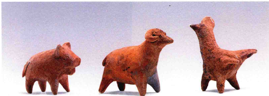
彩图 3 - 93 陶塑动物 石家河文化 高 6 - 9 厘米 湖北天门邓家湾出土 (正文第 109、111 页)