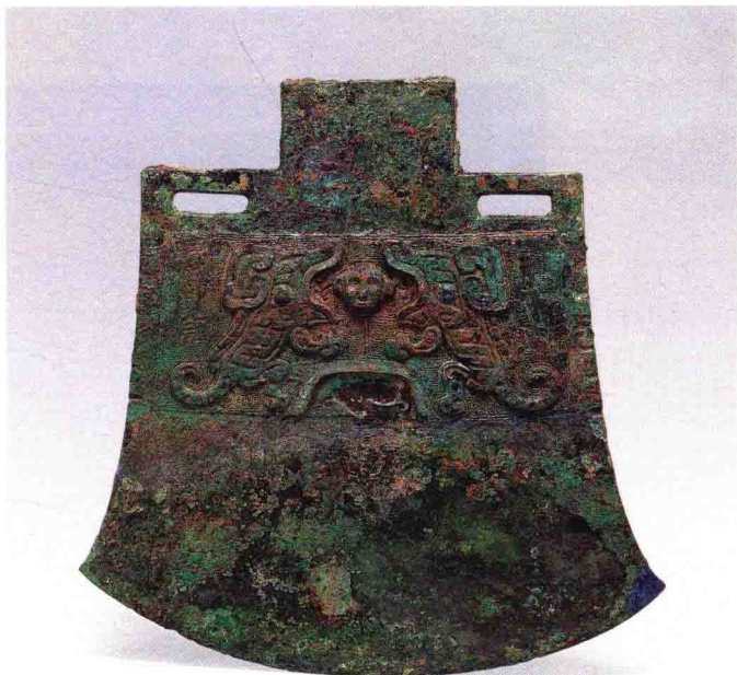
彩图2-8 “人兽母题”妇好青铜钺

商代晚期 高39.5厘米 河南安阳殷墟妇好墓出土 (正文第059-060、345页)