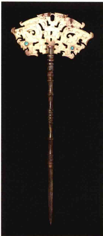
彩图3-99 兽面玉笄 山东龙山文化 长23厘米 山东临朐朱封出土 (正文第109、114页)