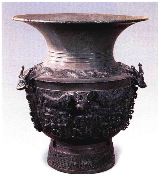
彩图2-7 “人兽母题”青铜尊

商代晚期 高39.5厘米 河南安阳殷墟妇好墓出土 (正文第059-060、345页)