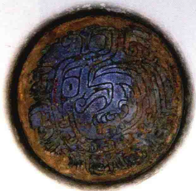
彩图 5 - 28 器外底带龙形图像的青铜簋 商代晚期 高 23.45 厘米 美国明尼阿波利斯艺术博物馆藏 (正文第 224 - 225 页)