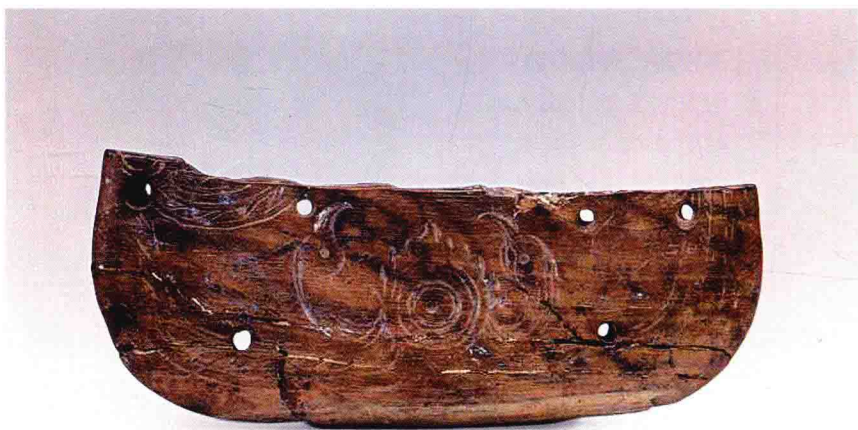
彩图 3 - 31 双鸟朝阳纹象牙器 河姆渡文化 长 16.6 厘米 浙江余姚河姆渡出土 (正文第 088 页)