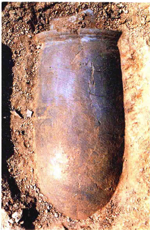
彩图3-111 刻划有图形 文字的陶尊出土现场 大汶口文化 高59.5厘米 安徽蒙城尉迟寺出土 (正文第115、118页)