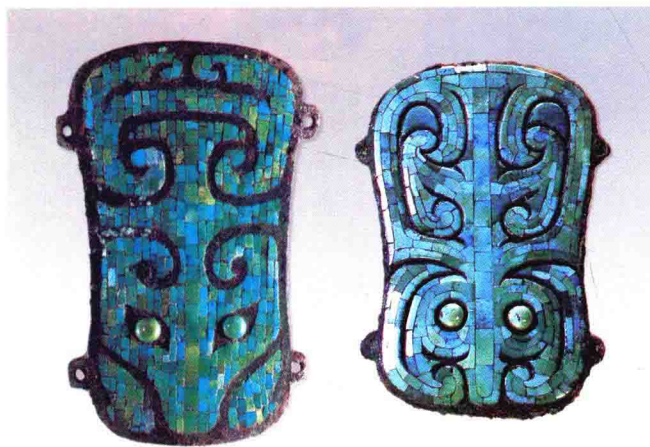
彩图4-7 镶嵌绿松石兽面纹青铜牌 二里头文化 左,长16.5厘米 右,长14.2厘米 河南偃师二里头出土 (正文第160-161、333页)