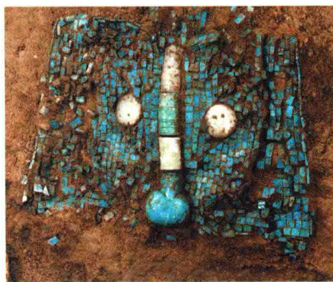
彩图4-13 龙形绿松石拼嵌及局部 二里头文化 长70.2厘米 河南偃师二里头出土 (正文第162、335页)