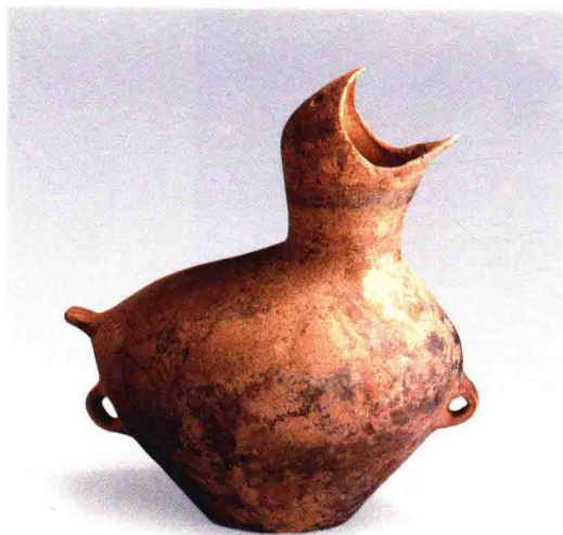
彩图3-154 鸮形彩陶壶 小河沿文化 高37.2厘米 内蒙古赤峰大南沟出土 (正文第133-134页)