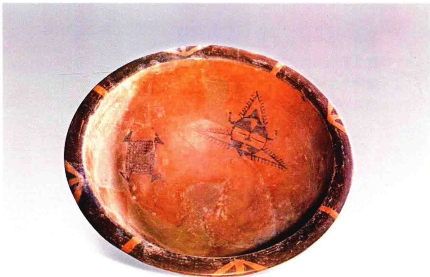
彩图 3 - 8 人面纹网纹彩陶盆 仰韶文化 口径 39.5 厘米，高 16.5 厘米 陕西西安半坡出土 (正文第 080 页)