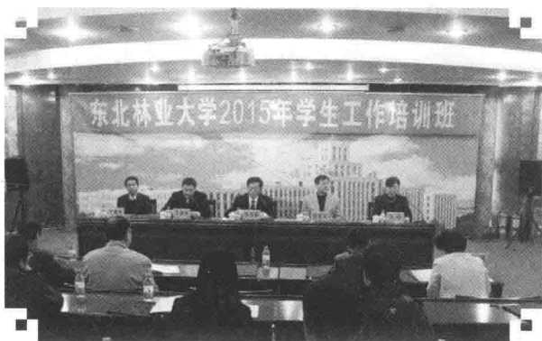
2015年10月，学校举行学生工作培训班

大力推行本科生导师制，不断完善班主任制度，充分发挥教师在学生培养中的主导作用和学生的主体地位。研究生教育实现二级管理，学院党委书记分管研究生思想政治工作，明确导师作为第一责任人。完