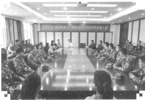
2015年9月9日，学校举行学生 应征入伍欢送会

政治情怀，高度重视加强爱国主义教育，把征兵工作作为一项政治任务来抓。近几年来，学校将大学生应征入伍工作纳入“树人工程”实施方案和学校人才培养工作体系。学校应征入伍人数从2014年的18人上升到2015年的52人，