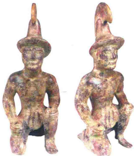
» 新源塞人青铜武士像(正面与侧面)

1983年夏，在伊犁新源县一处鱼塘基建时，意外发现了6件精美的青铜器，其中最引人注目的当属这一尊塞人青铜武士像。