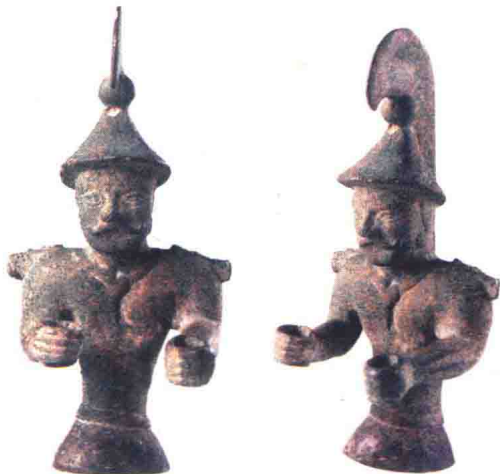
» 巩留塞人青铜武士像(半身正面与侧面)

如今塞人在民族融合的大潮中渐渐消失，但他们的血脉却代代相传，很多民族都融合了他们的血统。今天在新疆这片神奇的土地上，秉承着爱国爱疆、团结奉献、勤劳互助、开放进取的新疆精神，各民族间你中有我、我中有你，共同团结奋斗、共同繁荣发展！