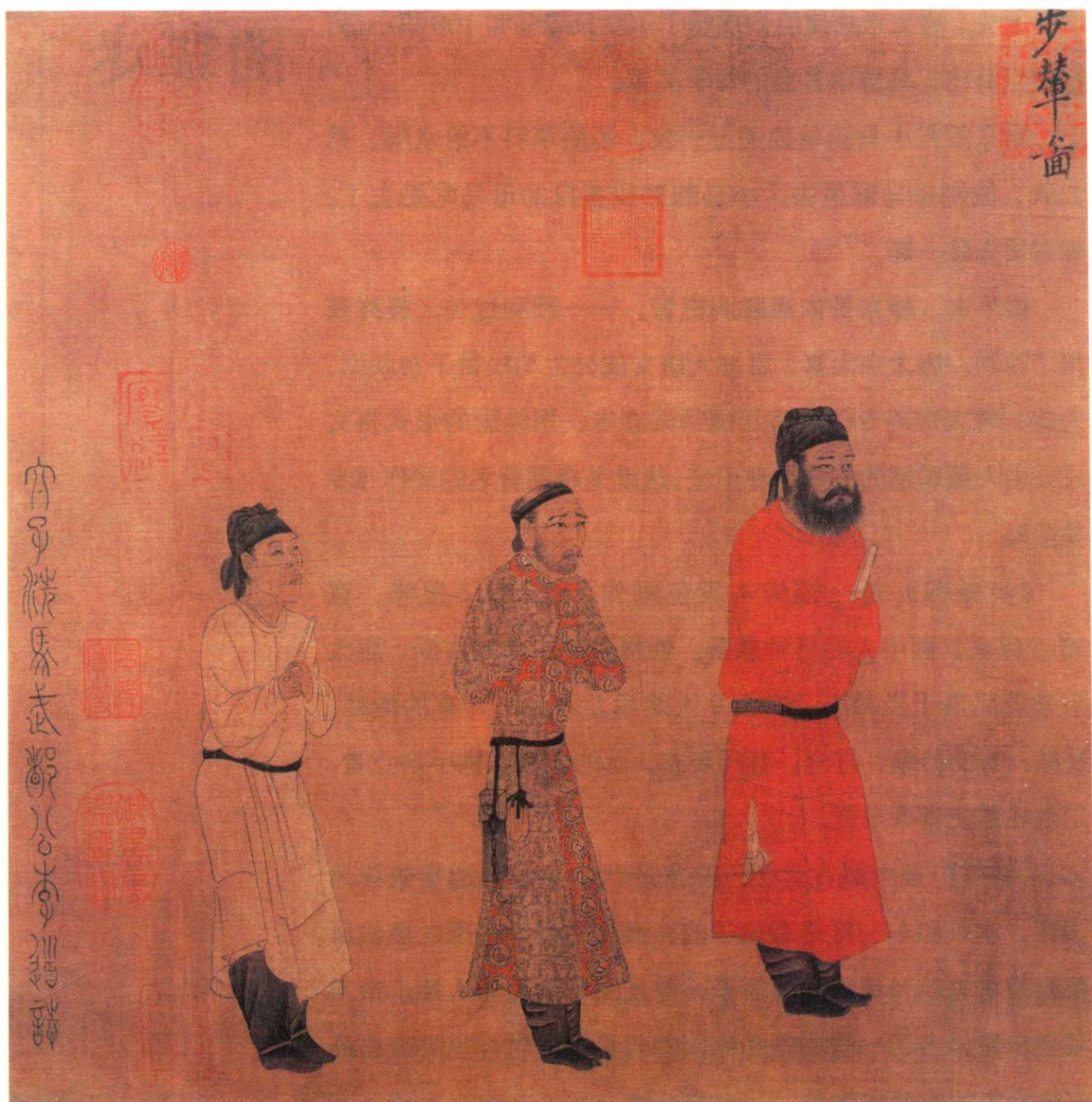
名称：步辇图 长：129.6 厘米 宽：38.5 厘米 年代：唐朝 作者：阎立本 级别：国家一级文物 现藏：北京故宫博物院

《步辇图》独具匠心、另辟蹊径。它没有描绘人物众多的文成公主出嫁送行的盛大场面，也没有刻画期待和欢乐气氛的松赞干布迎亲场面，而是选择了唐太宗接见禄东赞这一高端会见的情景，人物情节鲜明，生动地再现了唐王朝和西藏联姻的历史，更凸显了唐王朝和西藏的亲密关系。