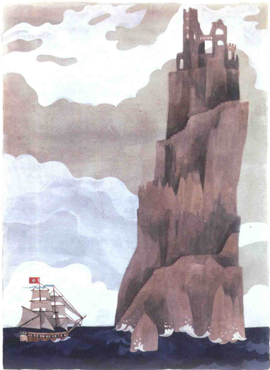
船在浪潮的带动下向前移动，不断接近岩石边唯一可见的登陆点： 一个被海浪侵蚀的木质码头