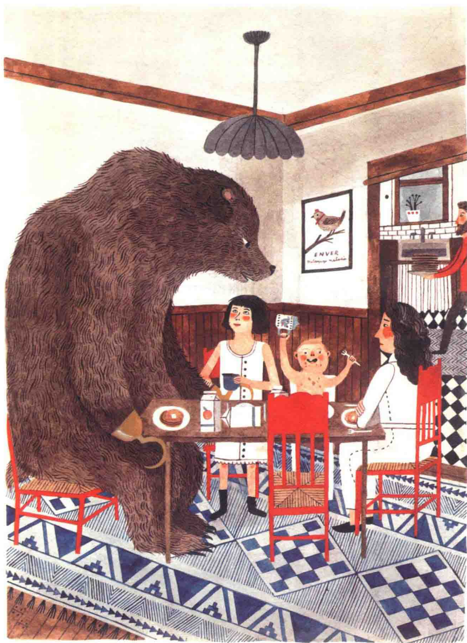
他俩目不转睛地盯着客人，后者几乎占据了大餐桌的一侧