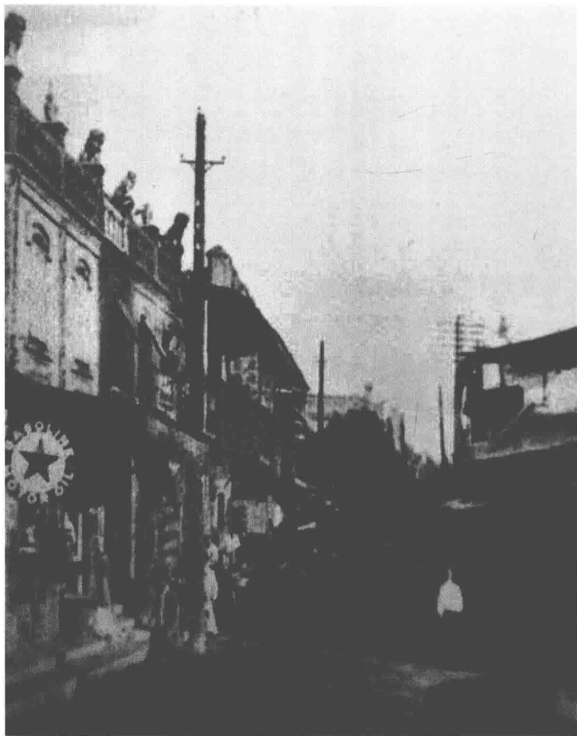
20世纪40年代的长治英雄路

底实现“耕者有其田”；三是继续开展更大规模的生产运动。大会将会场主席台命名为“英雄台”，会场所在的卫前街命名为“英雄街”。