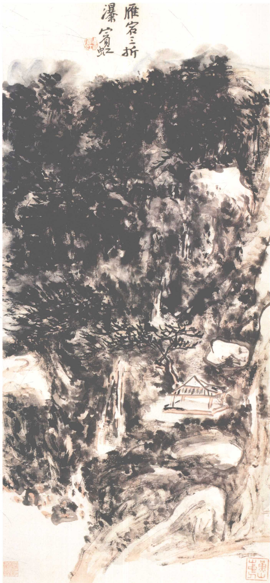
雁荡三折瀑 黄宾虹 纸本设色 浙江博物馆 藏 68cm×34cm 年代不详