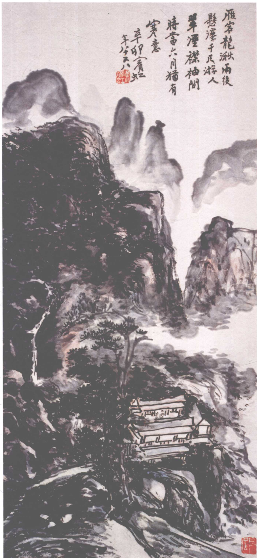
雁岩龙湫 黄宾虹 纸本 中国美术馆 藏 71.5cm×31.5cm 1950年