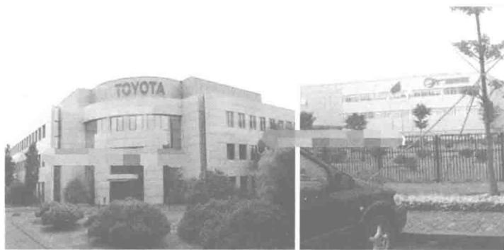
图 1-1 深入丰田现场，解密丰田 5S 管理 (1)

图 1-1 为丰田的大门——广汽丰田，这是企业楼层标识方法。很多工厂的楼房不少，但不标注是什么楼（如图 1-2 所示），比如办公楼、食堂、宿舍、车间一、车间二等，外来的人、新员工很难找到想去的地方，效率低。