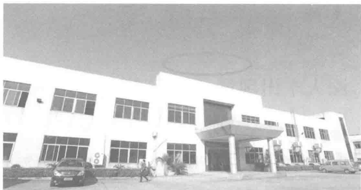
图 1-2 某企业大楼无标志