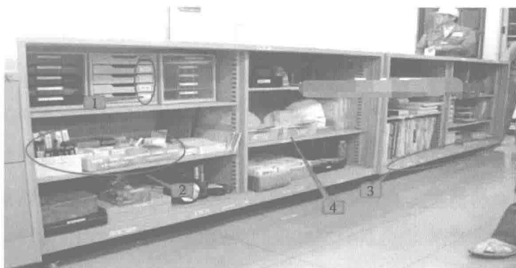
图 1-5 深入丰田现场，解密丰田 5S 管理 (4)

箭头 2：笔、工具、剪刀等小办公用品，全部用收纳盒按使用频率摆放，使用频率高的放在前面，使用频率低的放在后面。