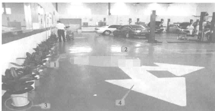
图 1-4 深入丰田现场，解密丰田 5S 管理 (3)