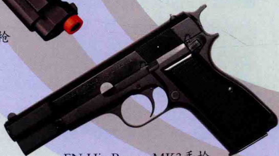
FN Hi-Power MK3手枪