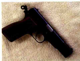
FN Hi-Power MK3手枪

FN Hi-Power MK3手枪的原型是美国设计师约翰·勃朗宁设计的，后由比利时的FN公司改进并生产。该枪投产数年后，第二次世界大战爆发，1940年FN公司被德军占领，于是Hi-Power手枪又成了德军的制式手枪。战后很多英联邦国家、南美国家和部分亚洲国家都将Hi-Power手枪定为军用制式手枪。