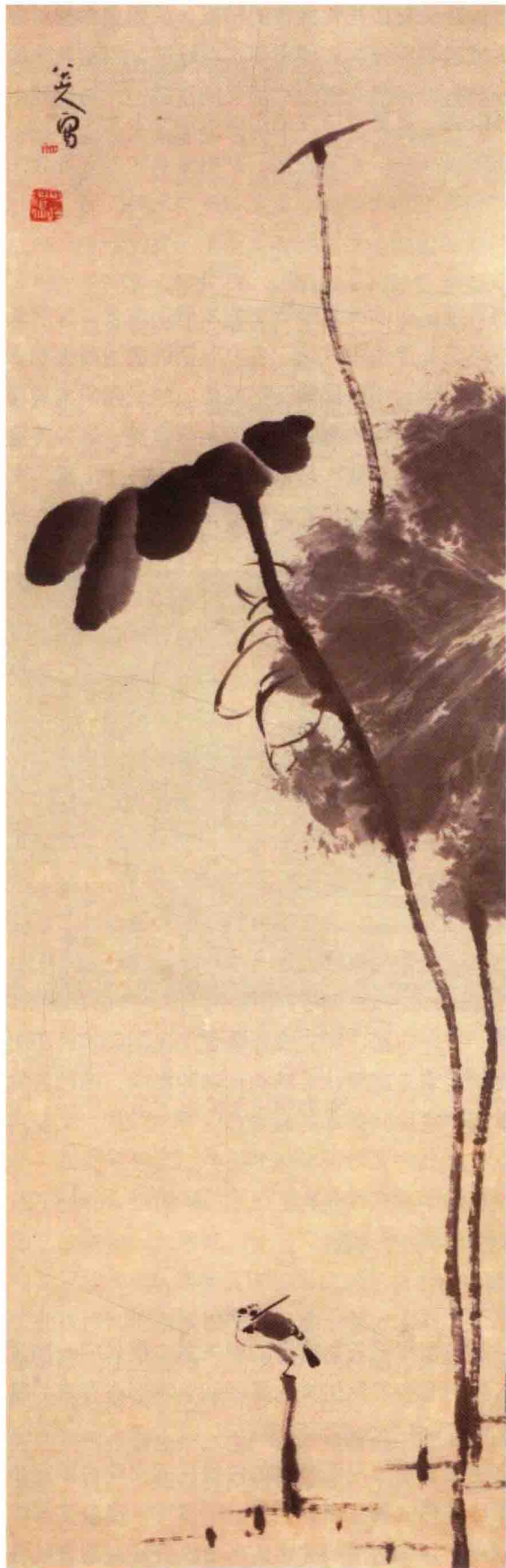
图1-2-3 八大山人的作品

感。文人美术和民间美术处于两种不同的文化层面：一者以表述情怀、抒发个人主观情感为主；另一者以实用、寄托民间大众的美好愿望为主。但这并不妨碍民间美术在创作图式和思想意境方面受到文人画的深刻影响，文人画的形式风格也被民间美术所吸收。在民间绘画和民间雕塑中，梅、兰、竹、菊，渔、樵、耕、读等题材比比皆是，其风格样式和意境与文人画一脉相承，虽然在表现方式上还存在着“雅”和“俗”的不同，但总体的图式、意境和思想意识等方面有很强的共通性。