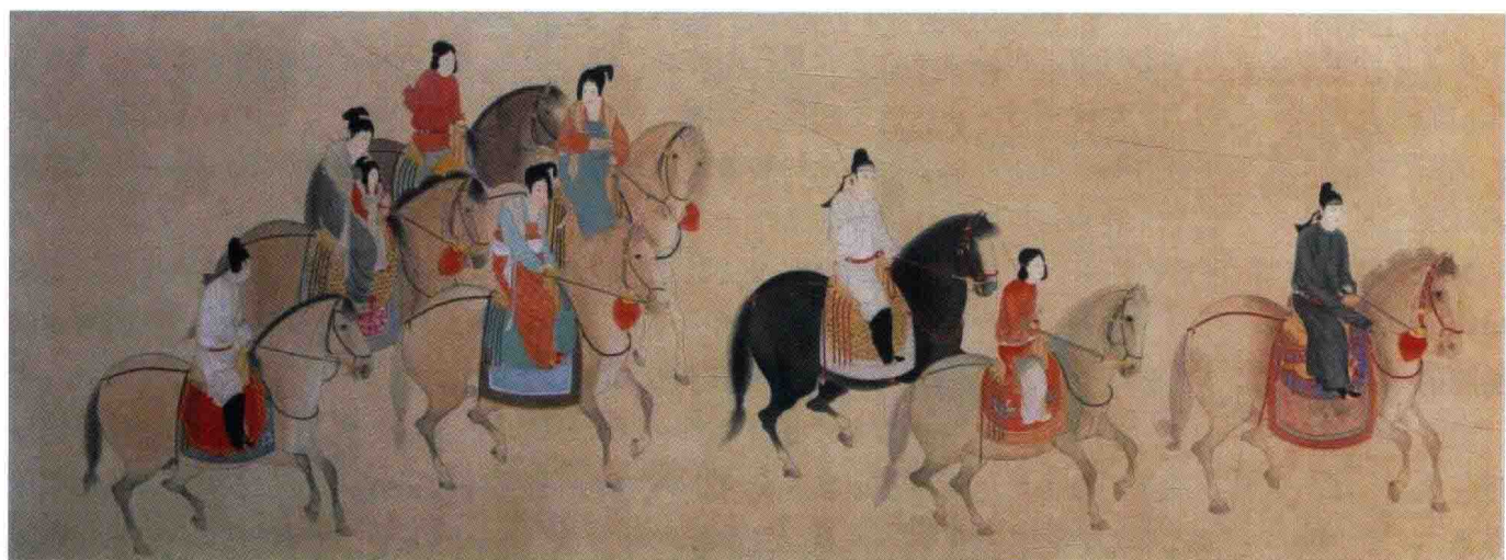
图1-1-7 《虢国夫人游春图》(唐·张萱)

如图1-1-7所示，此画是典型的宫廷美术作品，画家注重人物内心刻画，设色浓艳而不失秀雅，精工而不板滞，构图疏密有致，错落自然。画面洋溢着雍容、自信、乐观的盛唐风貌。