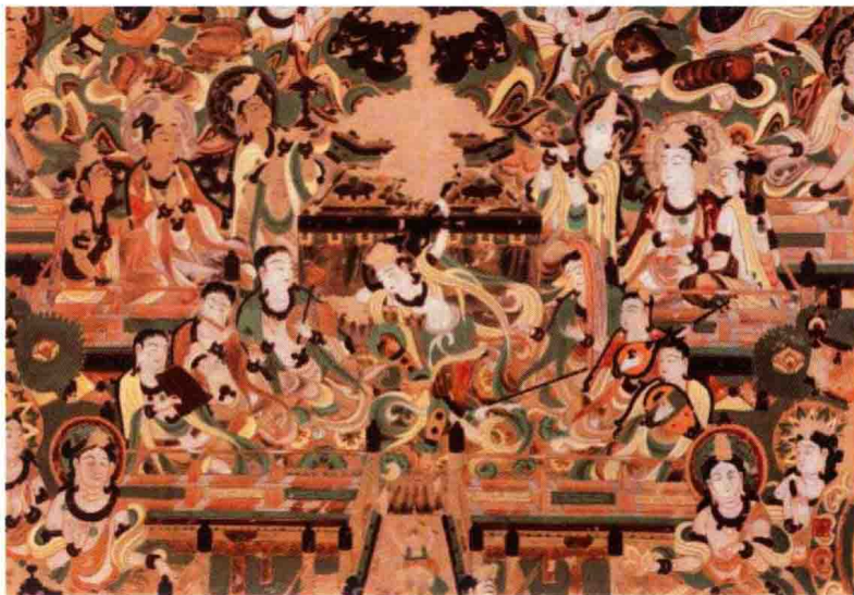
图1-2-4 莫高窟佛教壁画