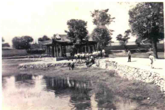
美丽的小西湖畔的护校女护士们

黄河一路向东流去，浩浩荡荡，两山夹一水，更显得山的雄美。城市与大山做伴就有了厚重与包容，有了大河的贯穿，便有了通达与灵动。兰州（古称金城）就是这样一座美丽的城市，甘肃省简称“甘”或“陇”，兰州市是它的省会，位于黄河上游。在兰州城的偏西方向，有一个美丽的地方——小西湖。