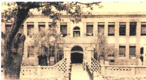
原中央医院旧址，新中国成立后为中国人民解放军西北军区第一陆军医院