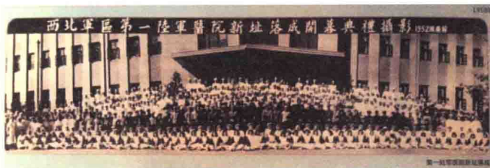
住院部大楼