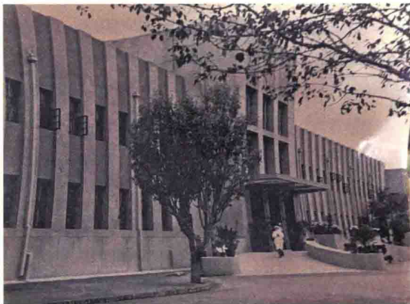
1952年10月，中国人民解放军西北军区第一陆军医院主体大楼落成