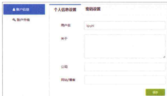
图 1-3 账号升级窗口

注册万彩动画大师免费账户后，该软件有部分功能是不可用的，如生成的视频中有“万彩动画大师”的水印。用户若想拥有其全部功能，须购买该软件。购买软件后，用户会在预留邮箱里收到激活码和代理 ID 号。用户在官方网站登录账号，然后单击左边的“账户升级”，浏览“账户状态”。用户单击“激活码升级”、完善个人信息、填入激活码和代理 ID，最后单击“账户升级”完成升级，如图 1-3 所示。