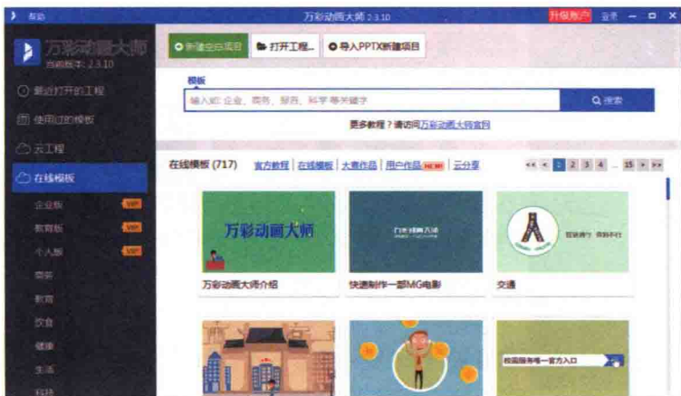
图 1-4 软件打开界面