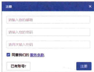
图 1-2 软件注册界面

通过上述步骤注册账号后，注册的邮箱会收到一个软件激活链接的邮件，打开自己的邮箱，单击邮件中的激活链接，完成账号激活。完成激活后，在软件中就可以账号登录，开始制作属于自己的动画视频。