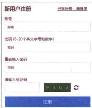
图 1-1 注册界面

软件使用前需要进行免费注册，注册的方法有两种。一是到其官方网站上进行注册，登录网站后进入注册界面，如图 1-1 所示，用户填写相关信息，以后就能以注册的账号登录。二是在软件上注册，单击软件右上角的“登录”进行账号注册（如图 1-2 所示），输入邮箱地址以及密码，单击“注册”。