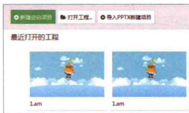
图 1-5 最近打开的工程

软件打开界面中,使用其左窗格中的“最近打开的工程”命令,可以打开工程文件。当单击“最近打开的工程”命令,软件右窗格中显示打开工程命令和用户最近使用的万彩动画大师的所有工程缩略图列表,如图 1-5 所示。若打开最近生成的工程文件,在工程缩略图列表中选择某一工程并单击鼠标左键,打开工程文件。若工程缩略图列表中没有要打开的文件,则单击打开工程菜单,从打开文件对话框中选择工程文件。