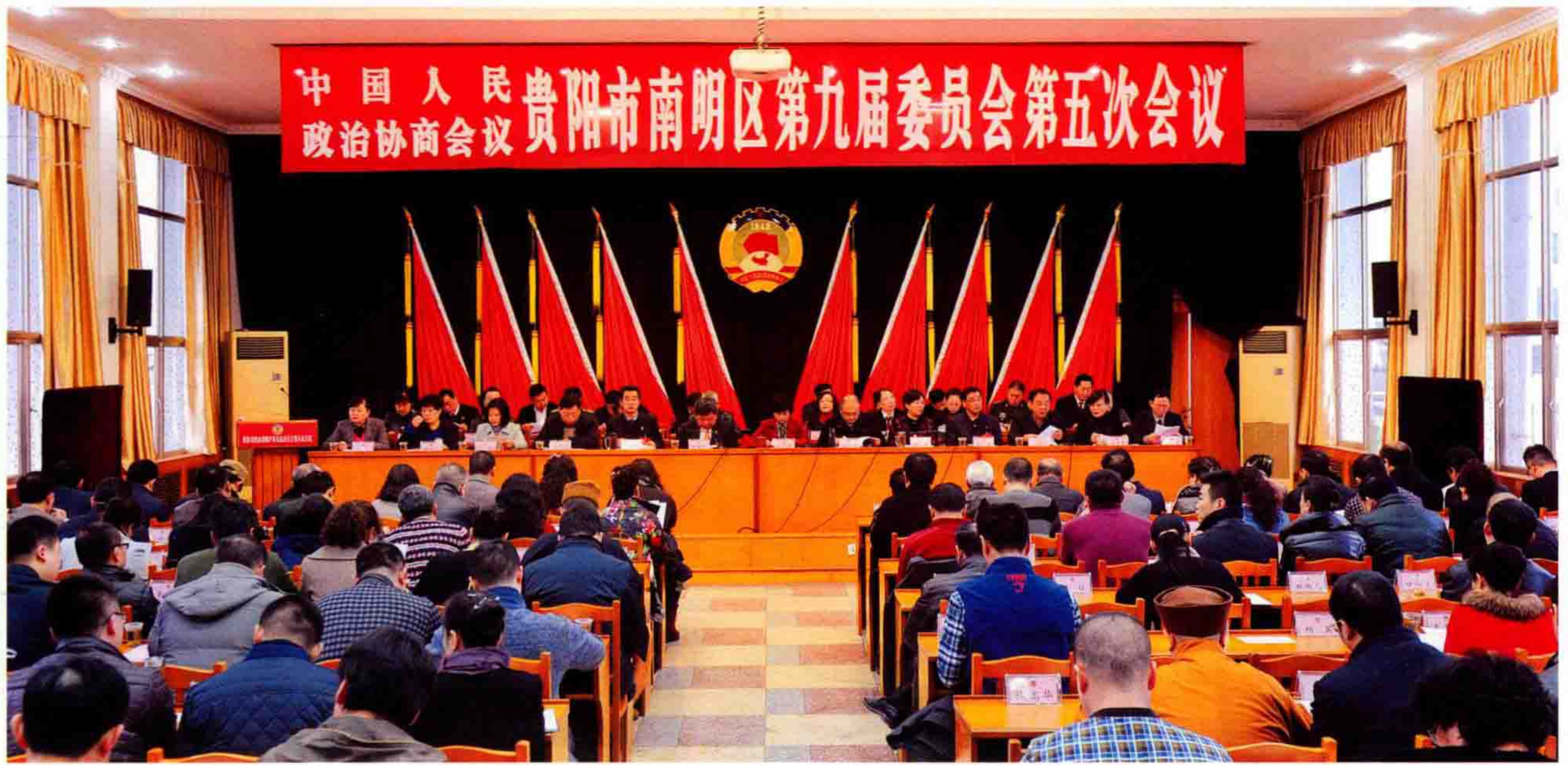
▲1月20日，政协南明区第九届委员会第五次会议召开