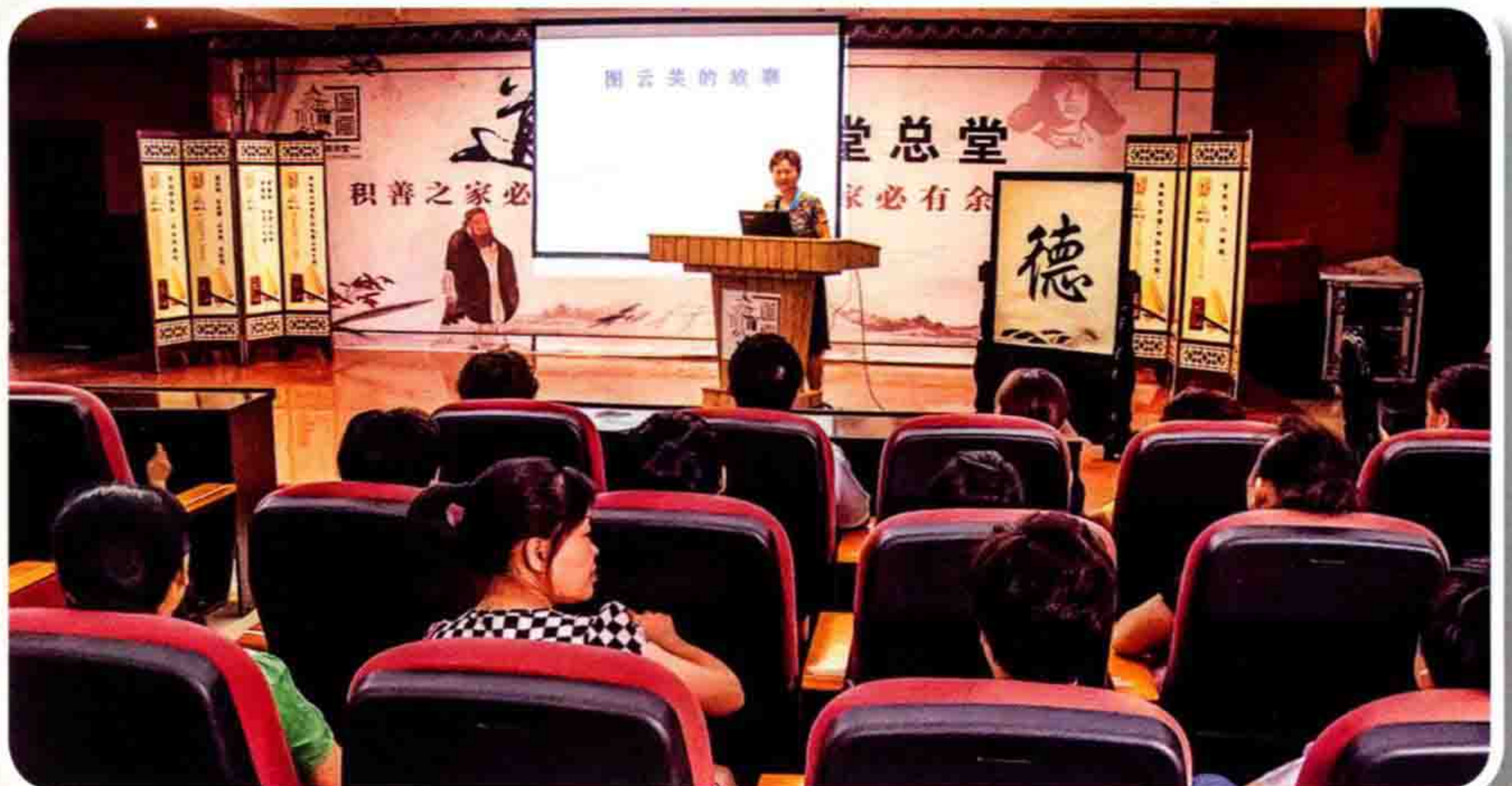
▶7月24日，南明区政协组织开展“委员进社区”活动