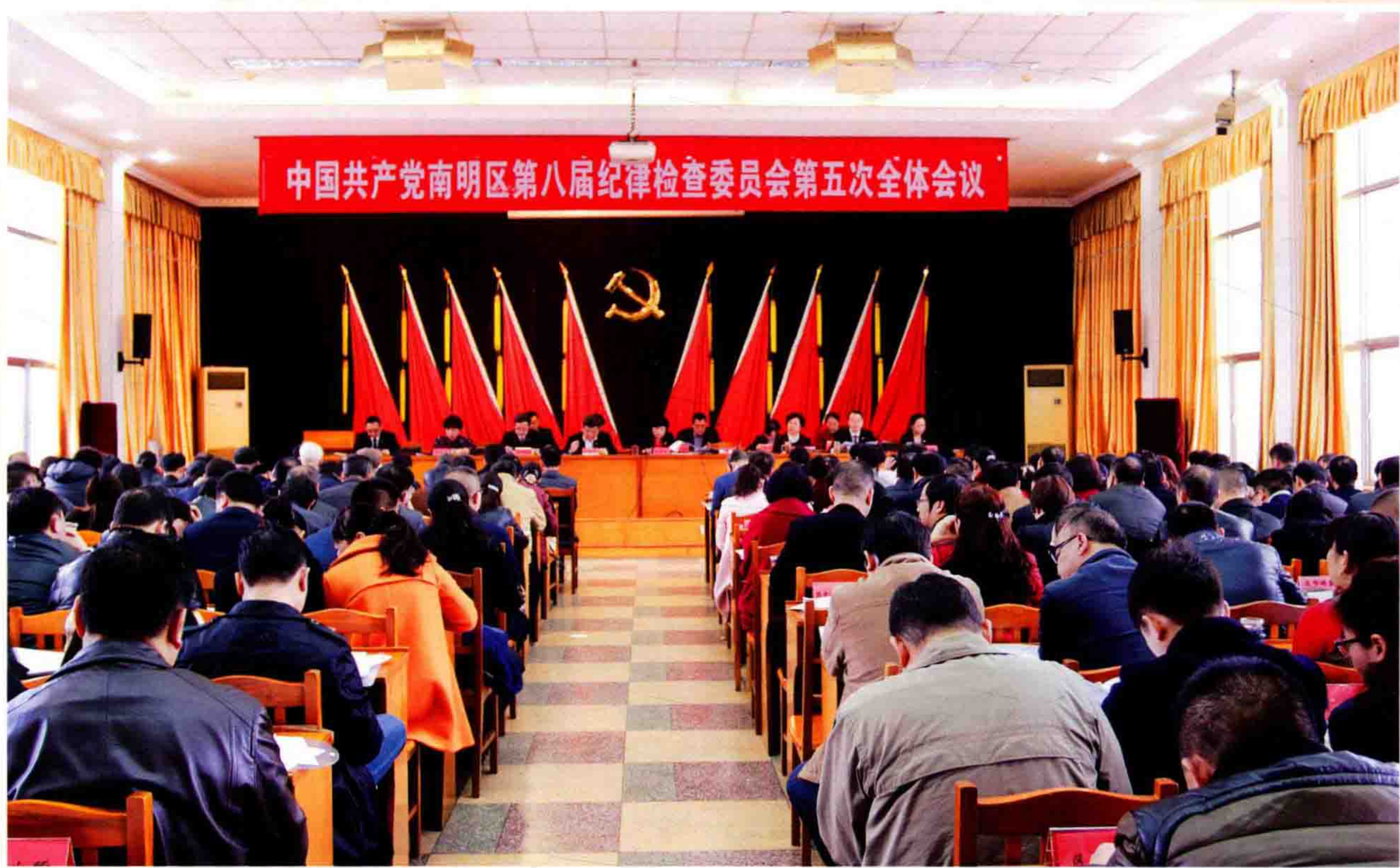
▲2月15日，中共南明区第八届纪律检查委员会第五次全体会议召开