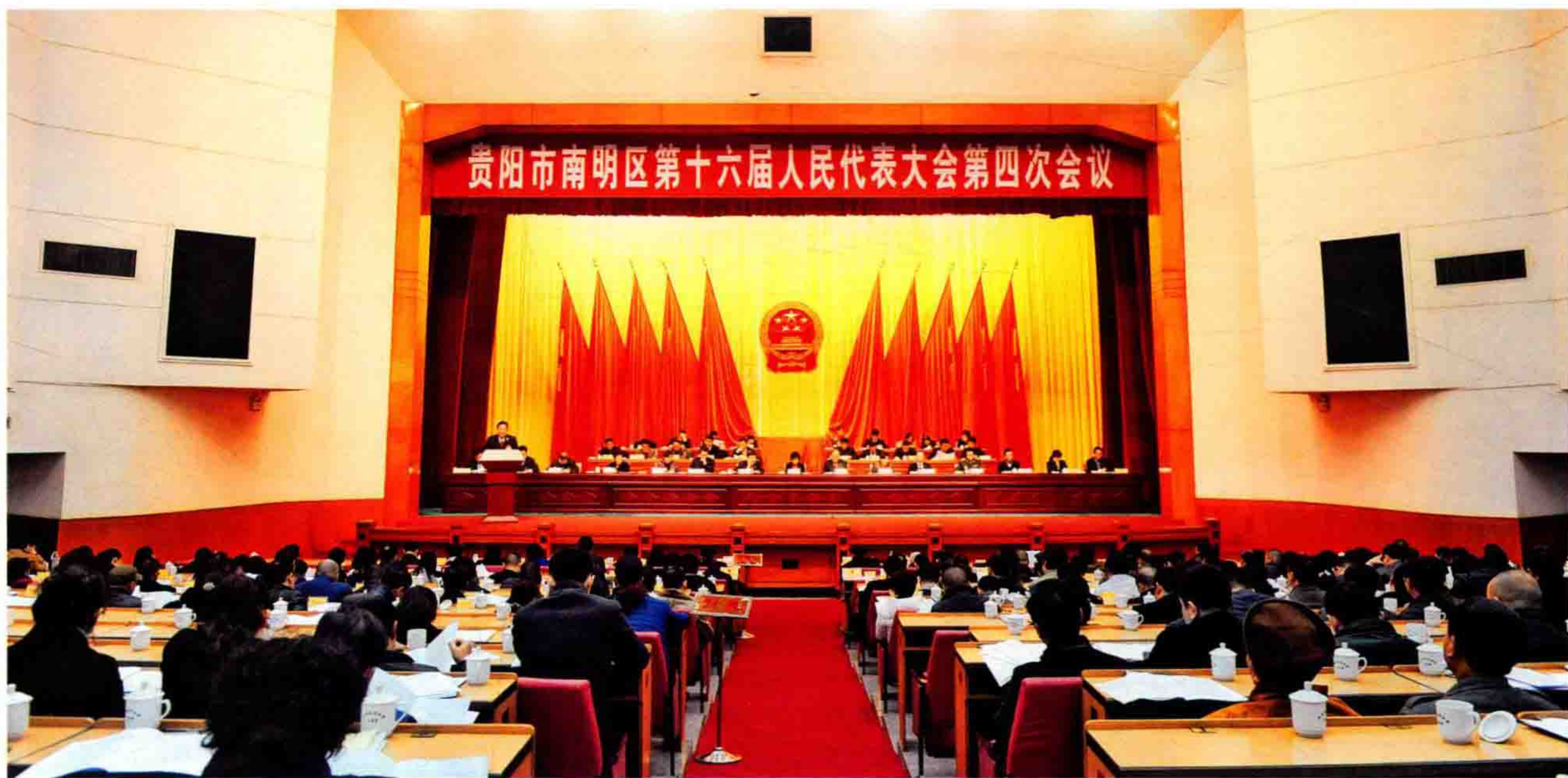
▲1月21日，南明区第十六届人大四次会议召开