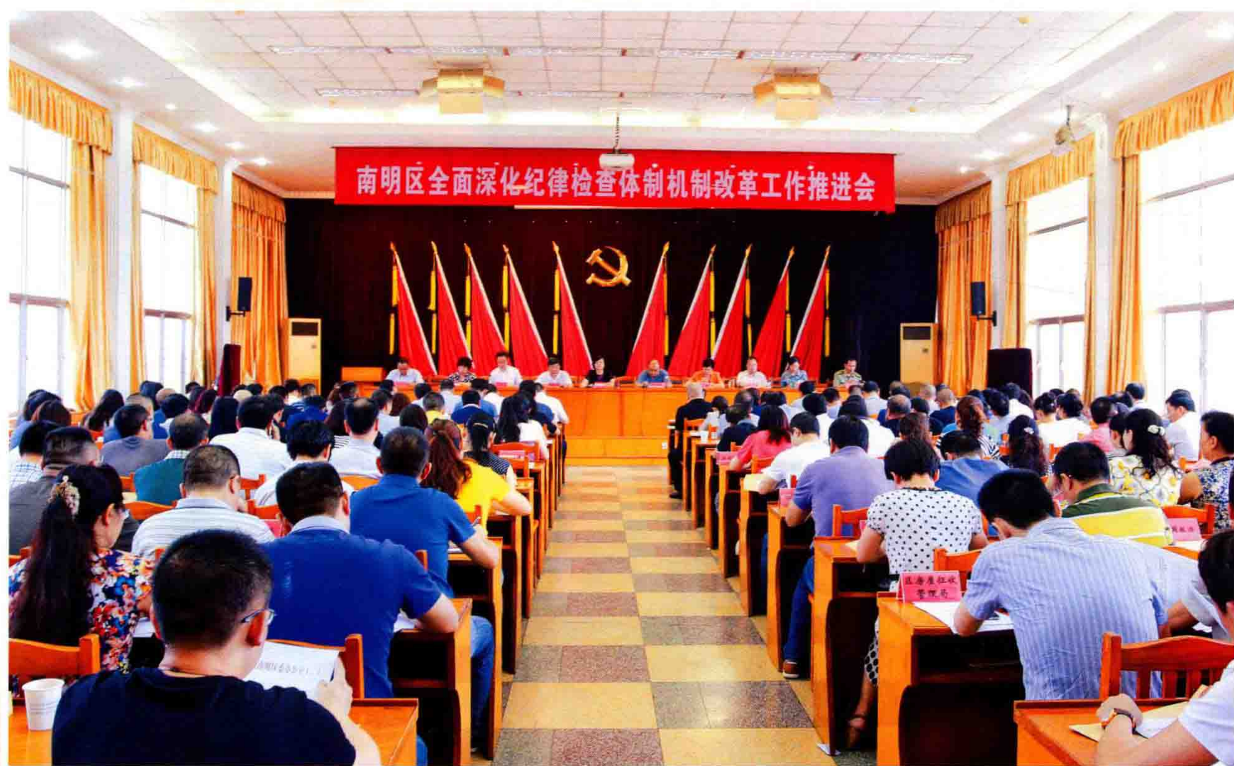
▲7月9日，南明区全面深化纪律检查体制改革工作推进会召开