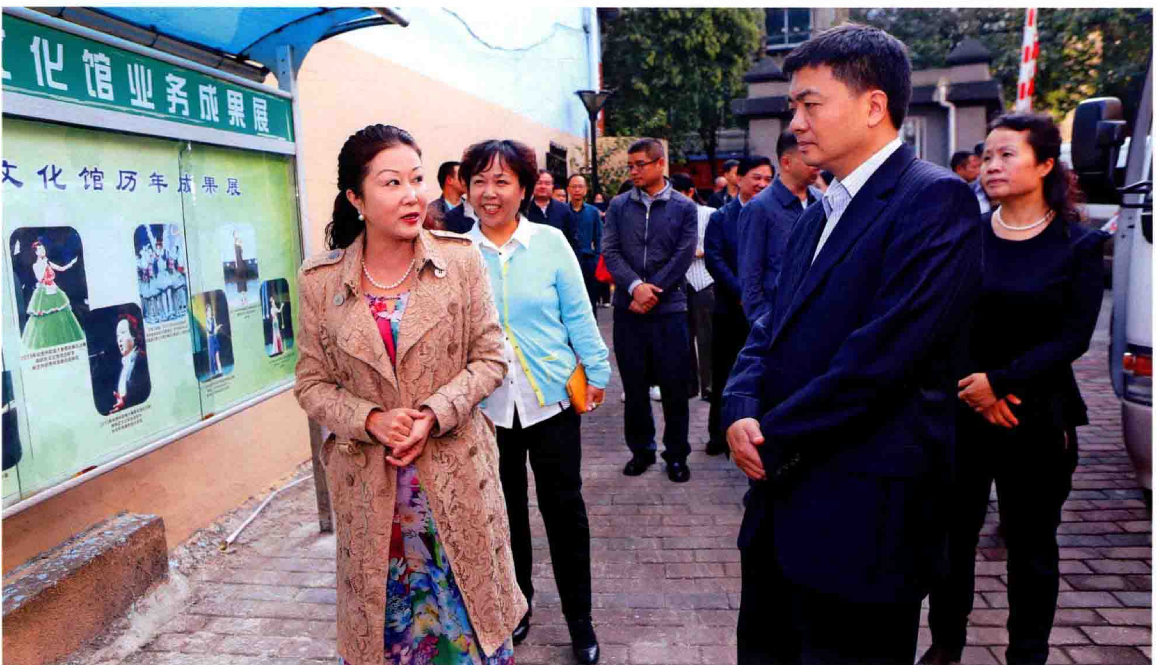
▲10月22日，省委常委、市委书记陈刚（右二）对南明区群众文化工作进行调研，市委常委、宣传部长兰义彤（右一），区委常委、宣传部长刘永贤（左二）等领导陪同