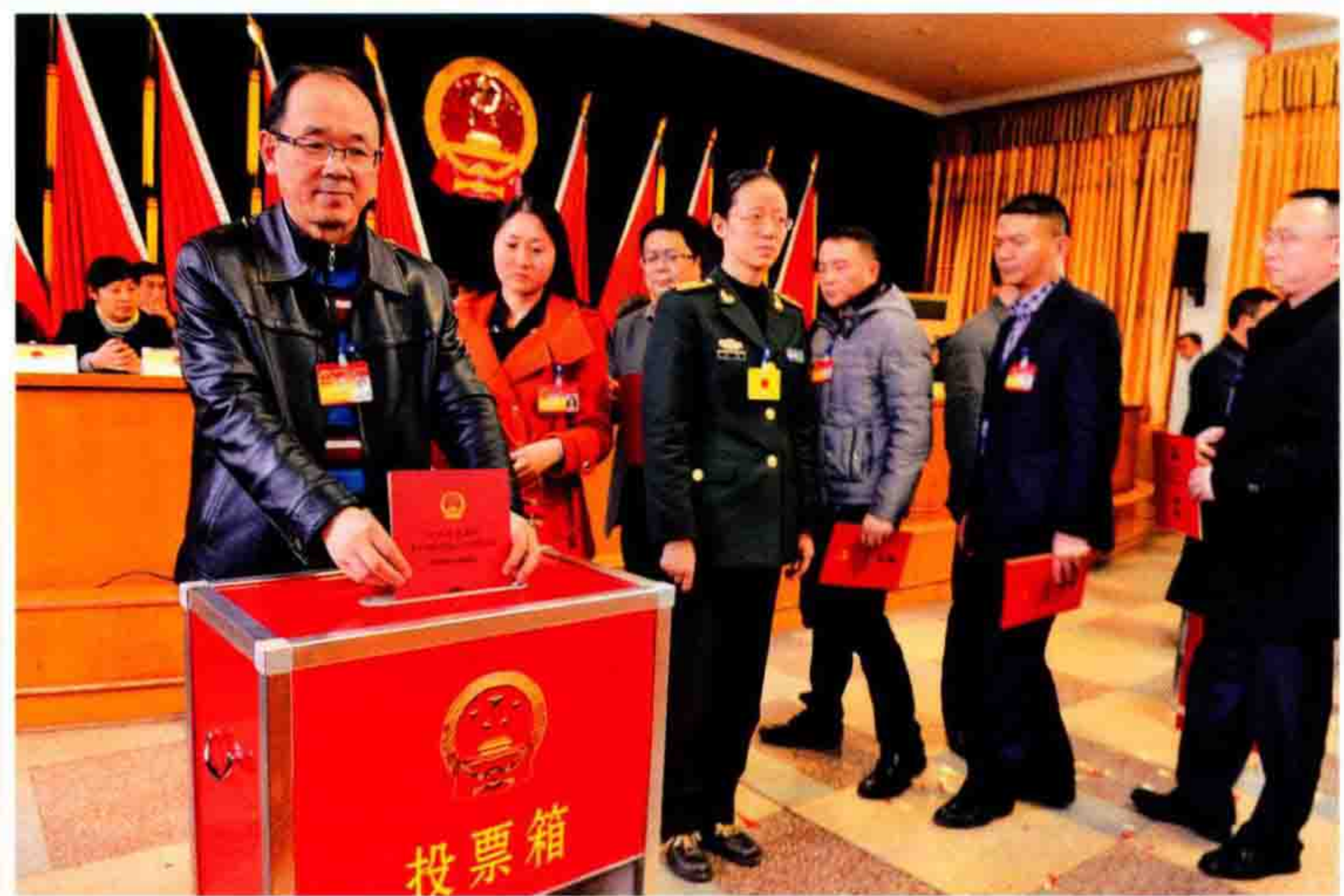
◀区十六届人大四次会议选举张海波为南明区人民政府区长