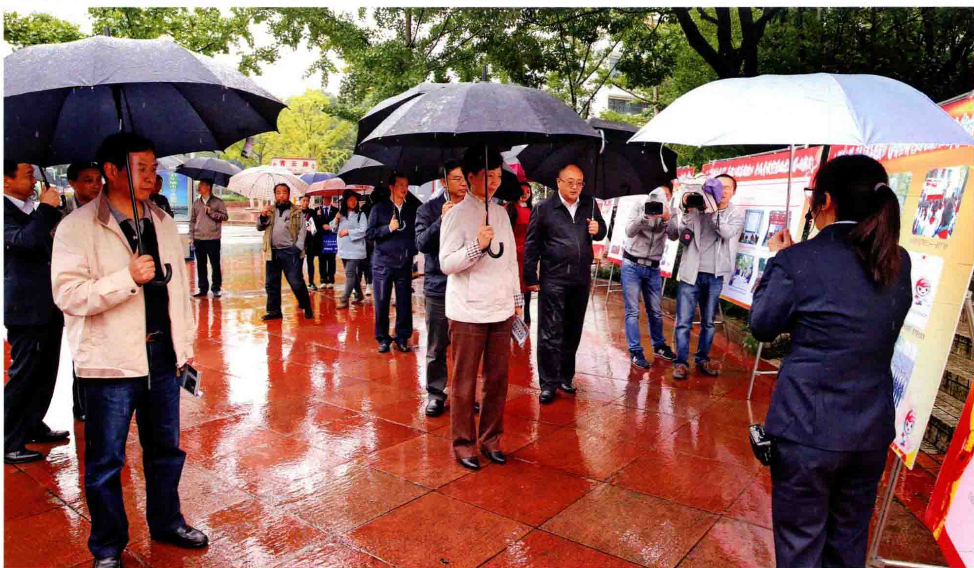
▲10月9日，省委副书记、省委政法委书记谌贻琴（中），省司法厅厅长吴跃（左一）到南明区调研基层司法改革工作，区长张海波（右四）陪同