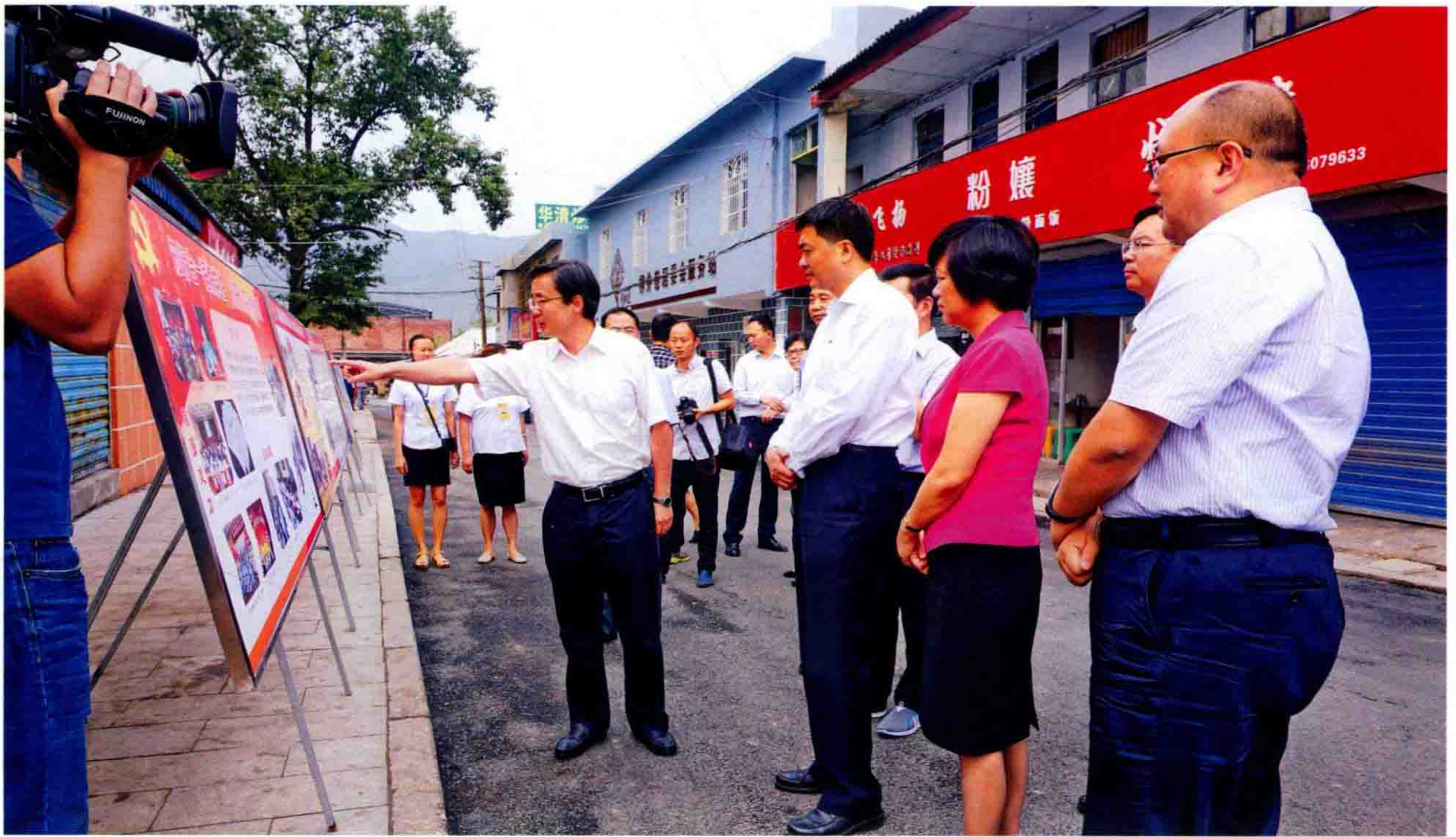
▲9月1日，省委常委、市委书记陈刚（左二）对南明区社区党建、流动人口管理、禁毒工作进行调研，区委书记朱丽霞（左三）、区长张海波（右一）、区委副书记田胜松（左一）等领导陪同