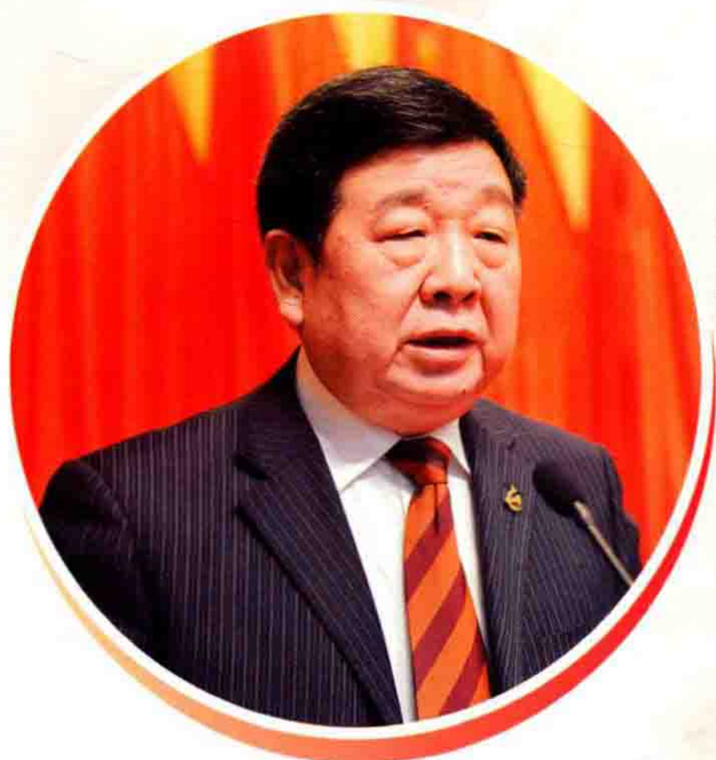
◀区人大常委会主任石惠忠在十六届人大四次会议上作人大工作报告