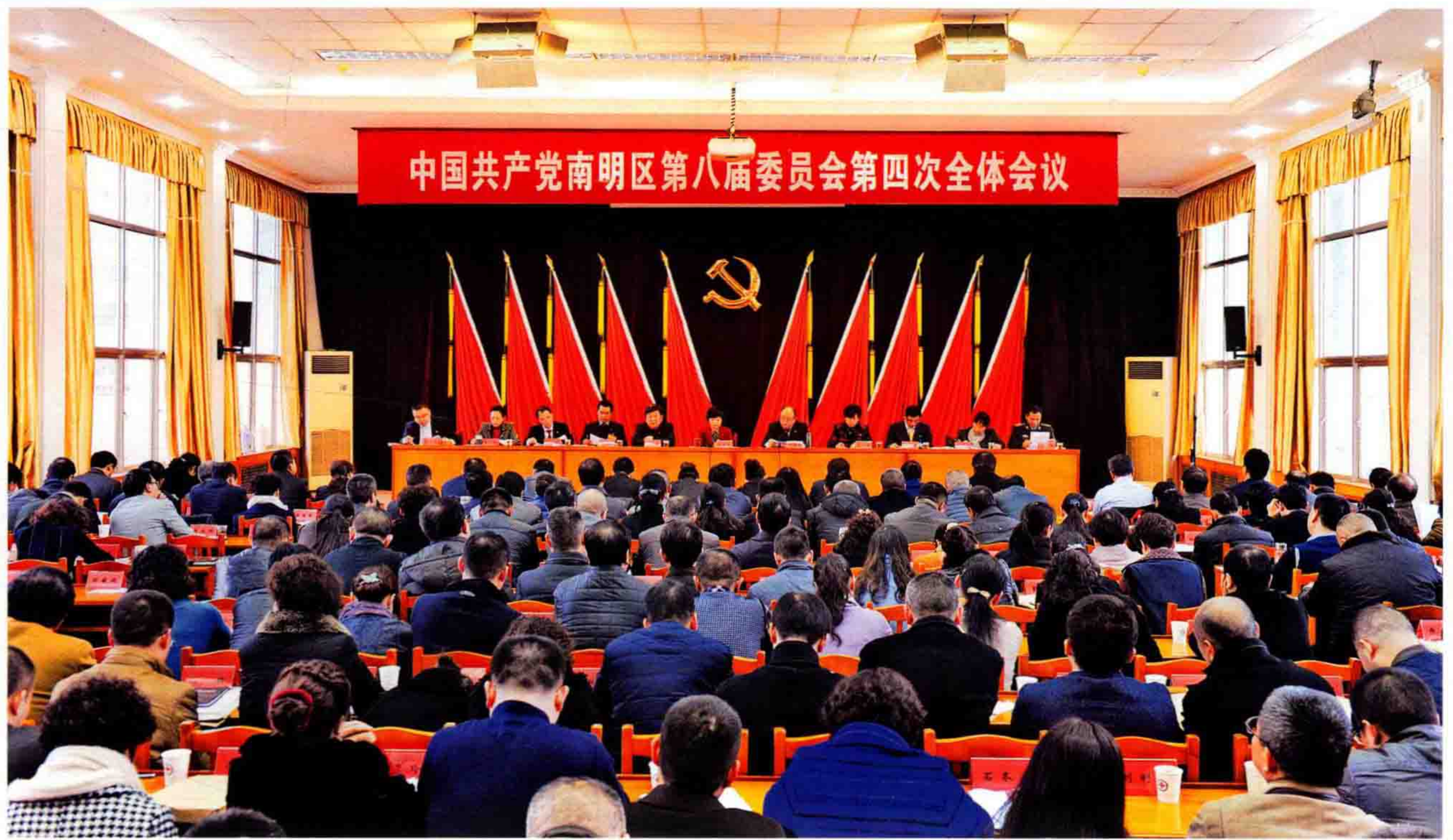
▲1月9日，中共南明区委八届四次全会召开