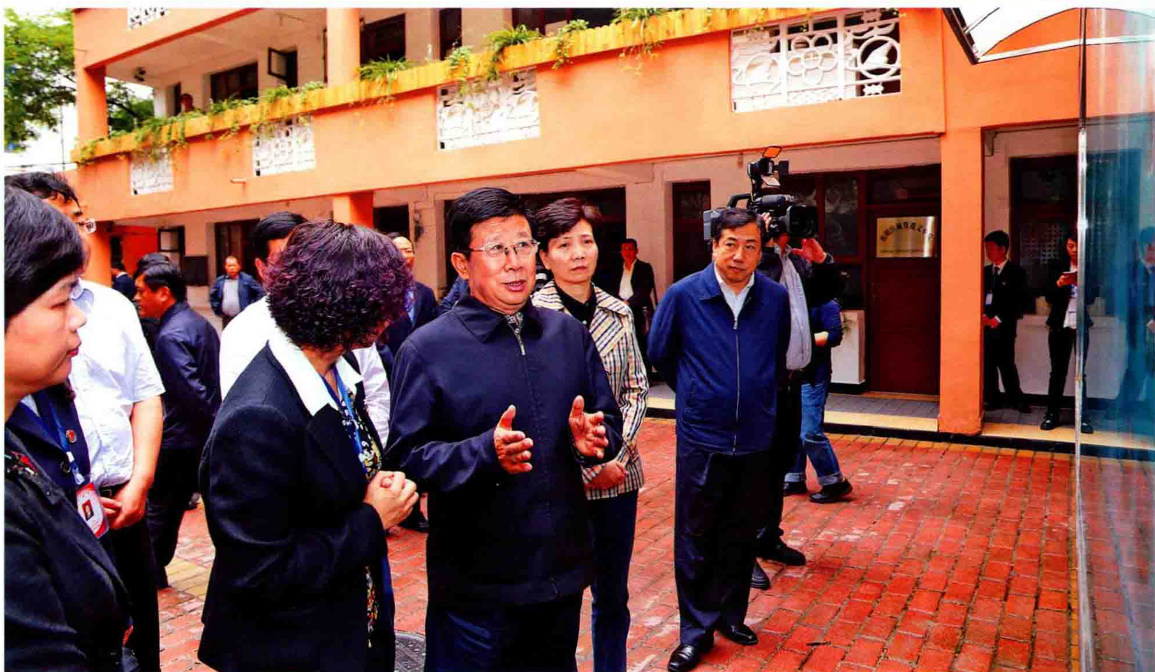
▲5月15日，时任贵州省委书记赵克志（中），省委副书记、政法委书记谌贻琴（右二），副省长、省政府党组成员、省公安厅厅长、省委政法委副书记孙立成（右一）率队到贵阳市南明区调研司法改革工作，区委书记朱丽霞（左一）陪同