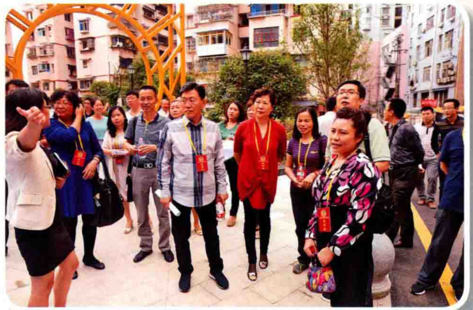
▲9月9日，南明区政协组织委员视察棚户区改造工作