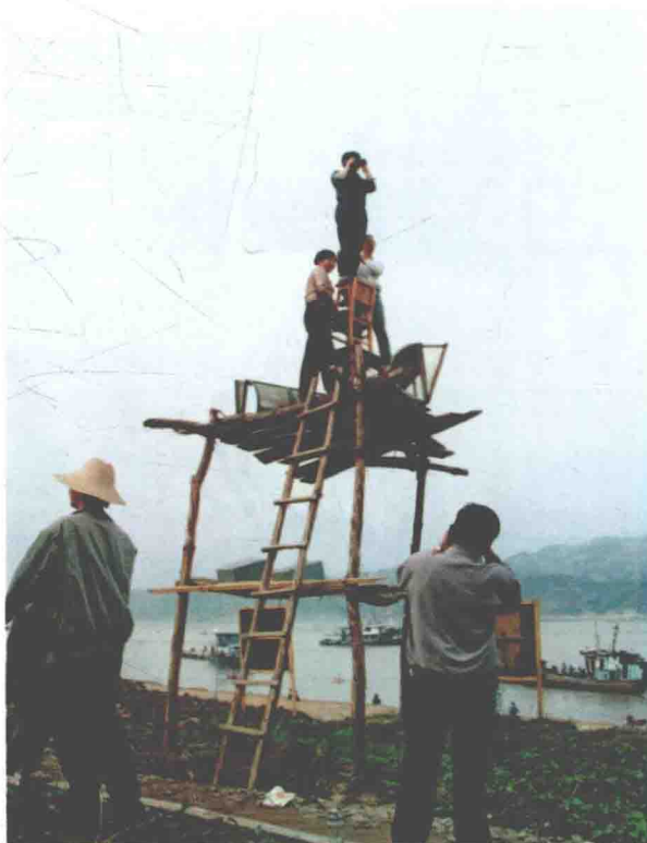
考古人员在拍摄中堡岛遗址全景