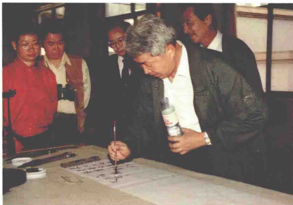
长江三峡文化资产维护考察团

金会共同发起的两岸学者共同组成的“长江三峡文化资产维护考察团”，由重庆沿江而下考察长江三峡文化遗产，并先后在宜昌和北京召开座谈会，与会领导和专家一致支持三峡工程建设，同时希望在做好三峡工程建设的同时，保护好三峡地区珍贵的历史文化遗产。