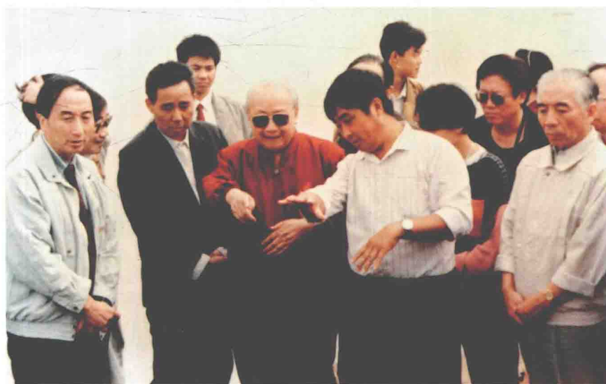
全国政协副主席钱伟长率政协考察团考察三峡文物工作