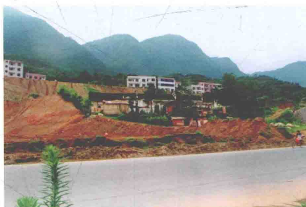
三峡坝区杨家湾老屋（维修前）