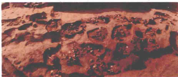
中堡岛遗址考古发掘出土的器物坑