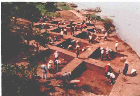
中堡岛遗址考古发掘工作现场

11月，国家文物局与湖北省文物考古研究所等全国24个科研院所和高校签订工作协议，组织大批文物工作者再次深入库区开展全面系统的文物调查、勘探、测绘、试掘工作，为三峡文物保护规划的科学编制提供丰富、翔实的