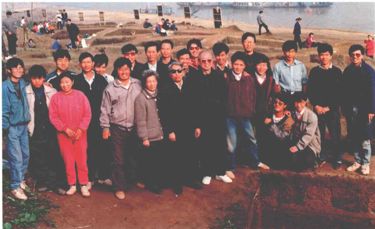
第七期田野考古领队培训班全体同学及考官在中堡岛遗址上合影

8月，在中国长江三峡工程开发总公司的大力支持下，湖北省文化厅组织省内考古力量全面展开三峡工程坝区抢救性考古发掘工作，湖北省文物考古研究所与宜昌博物馆先后有计划地发掘了长江两岸的白庙、鹿角包、大坪、杨家湾、三家沱、朱淇沱、茅坪、三斗坪、中堡岛等多处古文化遗址，发掘面积达2万平方米，勘探面积达21万平方米，揭示出一大批距今7000年前至汉代乃至明清时期内容丰富的文化遗存，清理出大量房基、水沟、灰坑、陶窑、墓葬等遗迹，获取了数以万计不同时代、不同质地的珍贵文物。同时，湖北省文物考古研究所还对坝区杨家湾老屋等3处古民居进行了调查、测绘、照相和文字记录等留取资料工作。