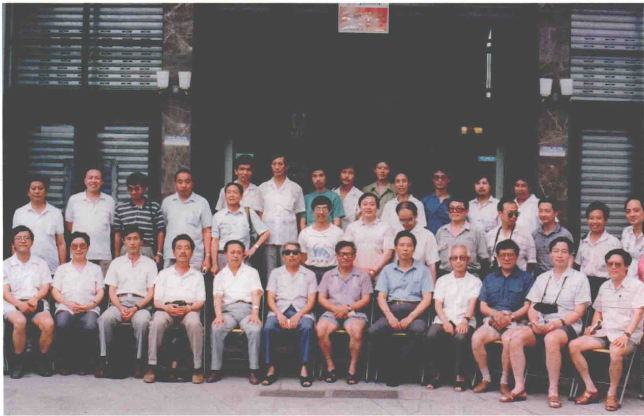
国家文物局三峡文物考察组

7月15日，湖北省文化厅正式向国家文物局提交了《湖北省文化厅关于上报〈长江三峡工程坝区范围文物保护单位及经费预算报告书〉的报告》（鄂文文物字〔1992〕第213号）。