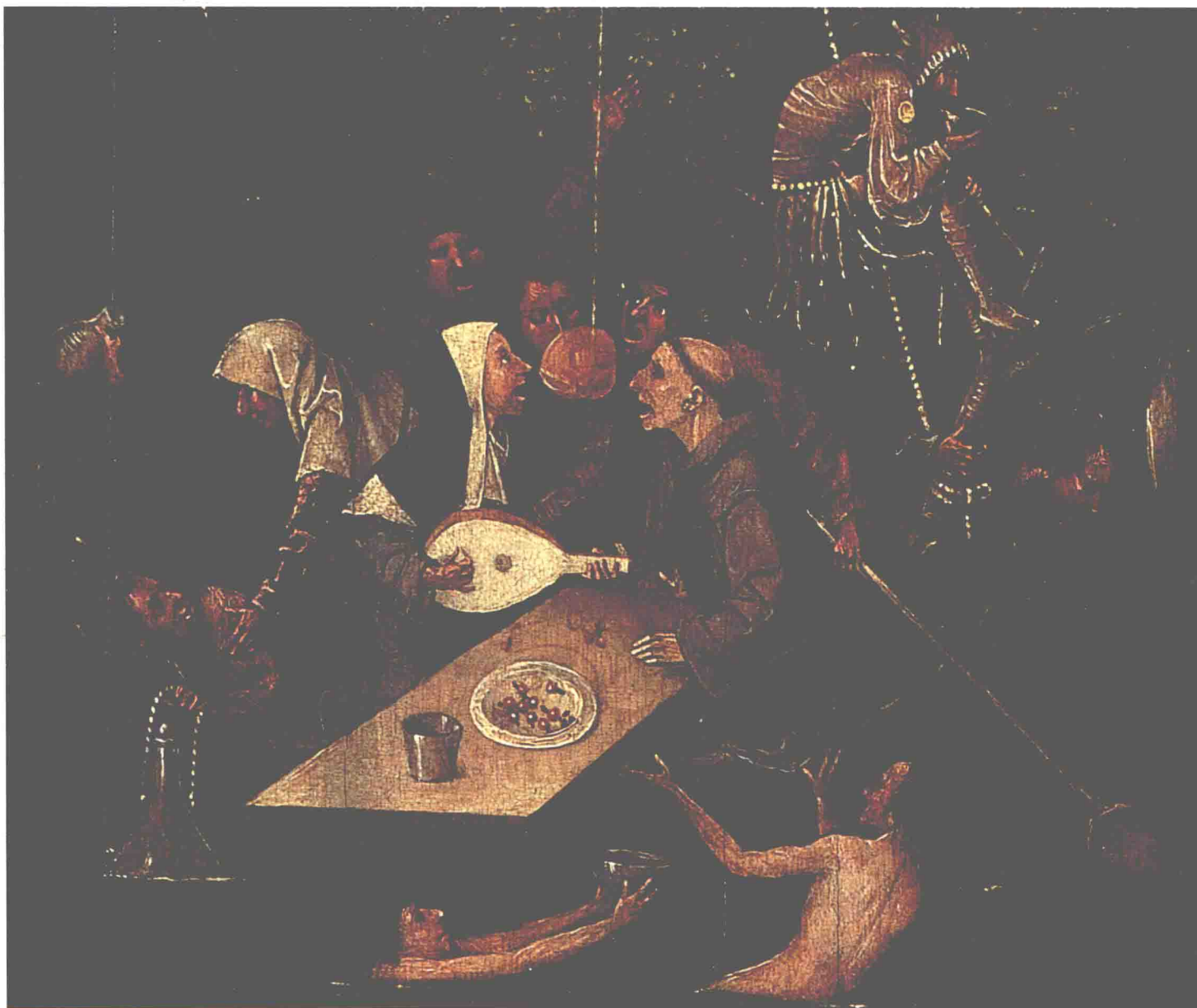
希罗尼穆斯·博斯，《愚者之船》(局部)， 约1490—1500年

1725—1848年，卢浮宫的方形沙龙被用于举办皇家绘画与雕塑学院的艺术展，史称“沙龙展”。1750年，一批精选的王室藏画在卢森堡宫一间套房中对外展览，每周展出两个半天，同时开放的还有美第奇画廊，里面陈列着由鲁本斯创作的系列油画作品。这项展览活动直至1779年才落下帷幕，它具有博物馆的雏形，是先于卢浮宫的最早的探索。随着公众对艺术藏品展的需求日渐强烈，博物馆在文明社会中的作用越来越朝着现代博物馆的方向发展。在百科全书派兴起的18世纪，人们设想着将那个时代中享有盛誉的各个画派的代表作汇集于一处，包括外国的绘