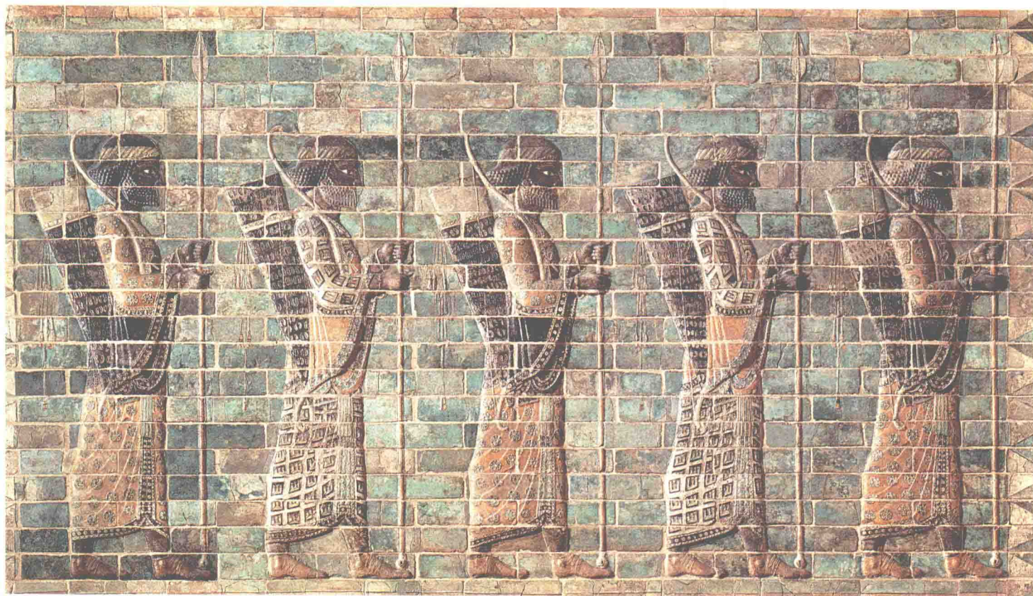
《波斯弓箭手卫队》(局部)

1674年，卢浮宫的扩建工作被下令中止。四年后，路易十四(1643—1715年在位)将宫廷迁往了凡尔赛宫。尽管如此，这位“太阳王”承袭了弗朗索瓦一世树立的传统，不惜斥巨资充实王室的收藏。他收藏的艺术名作主要来源于两次大手笔的采购：一次是买下了红衣主教马萨林的画廊中的大部分藏品，另一次是收购了银行家雅巴赫的全部个人收藏。路易十四的藏画最初被集中存放于卢浮宫和毗邻的格拉蒙酒店，那里布置得就像是一座真正的博物馆，后来渐渐分散至多座皇家宫殿。路易十五(1715—1774年在位)即位后，巴黎成了欧洲艺术品市场的中心之一，他仅仅通过购买卡里尼亚诺亲王去世时(1742年)留下的收藏品就为王室收藏增加了几十幅外国绘画，其中大部分出自佛兰德斯和荷兰的画家之手。正是在这个时期，构建一座集中存放王室