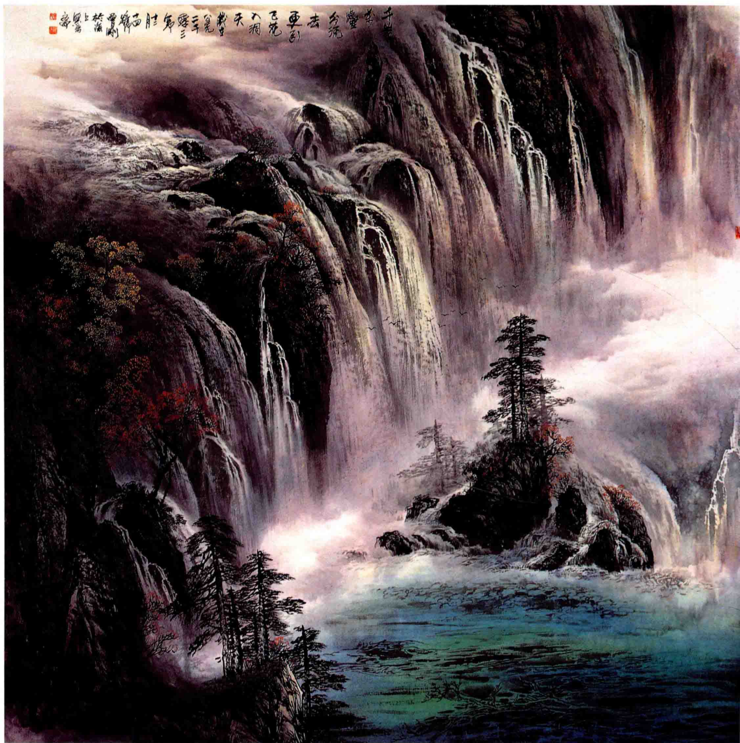
更引飞花入洞天 145 × 145cm