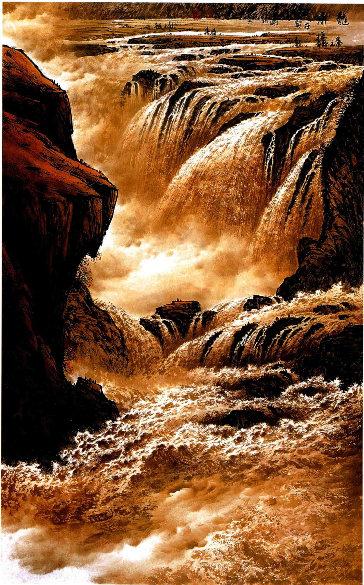
龙啸 96 × 60cm