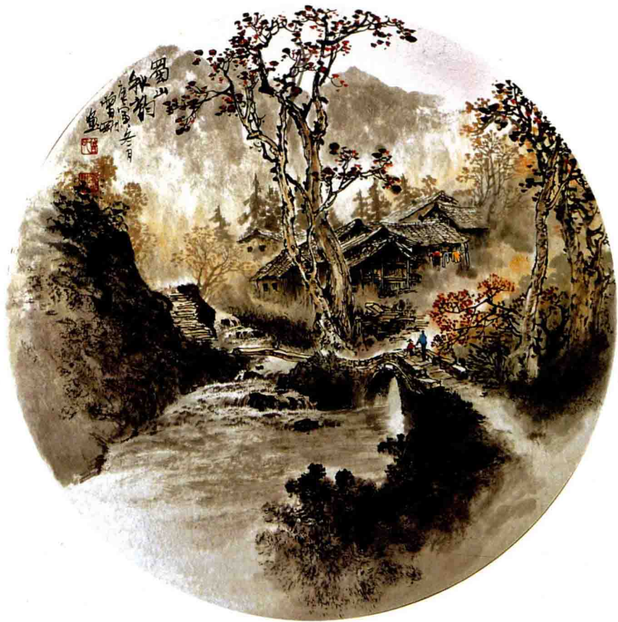
蜀山秋韵 45 × 45cm