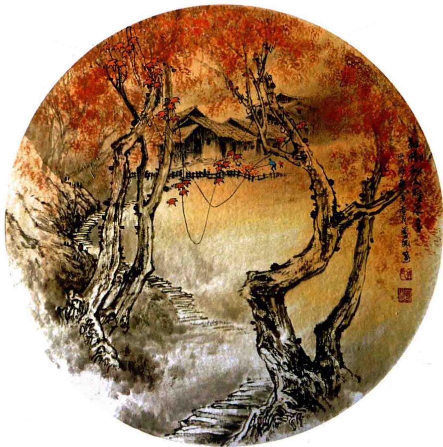
红树秋山雁来多 45 × 45cm