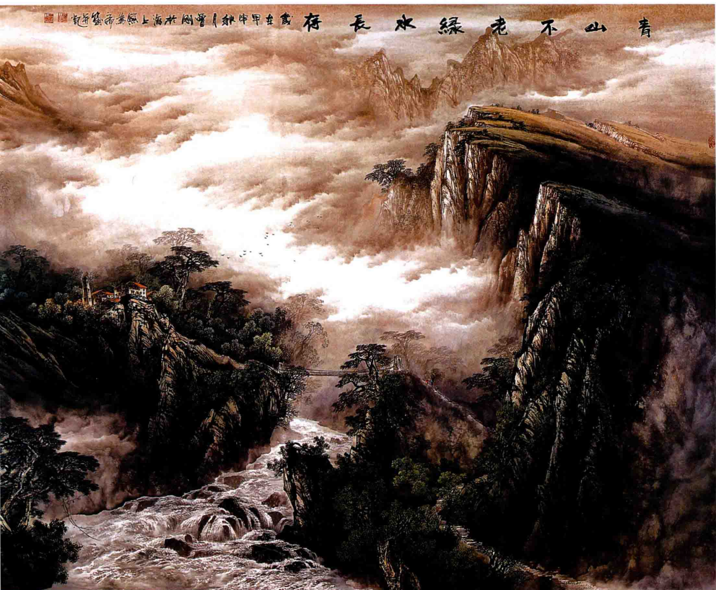
青山不老 绿水长存 495 × 195cm