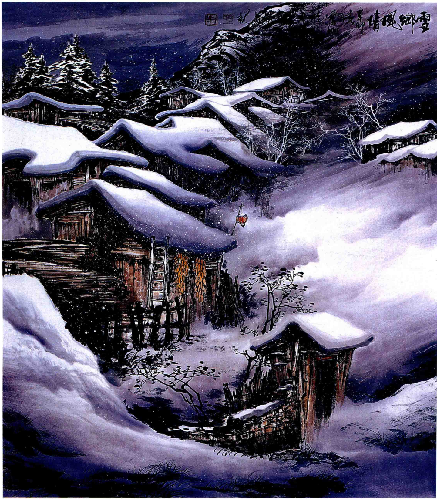
雪乡风情 96 × 90cm