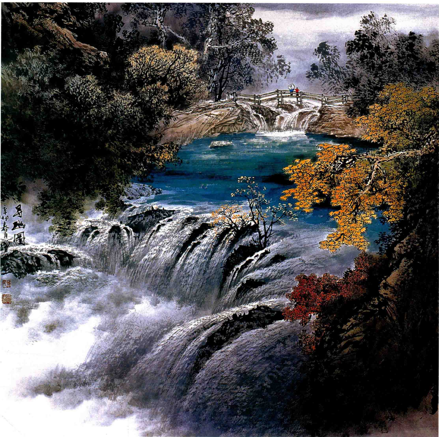
寻幽图 68 × 68cm