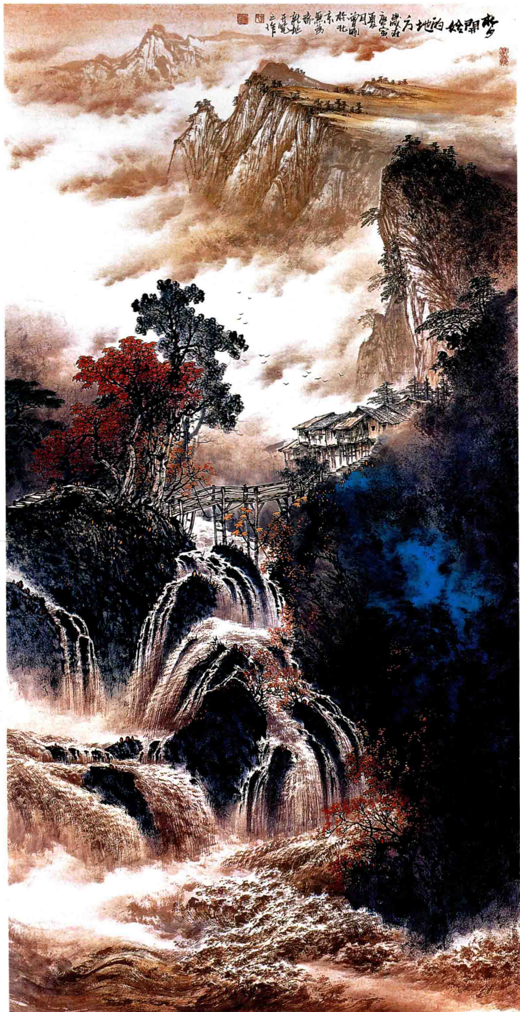
梦开始的地方 136 × 68cm