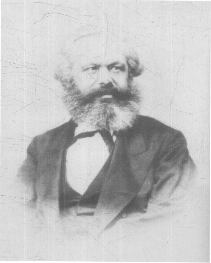
马克思 (1867 年)