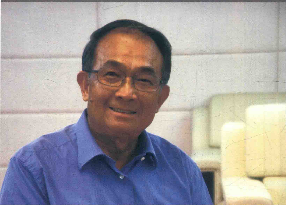
2016年7月11日，李容根讲述在深圳从事政务、党务工作的经历

李容根，1950年生，广东宝安人。1975年至2000年，先后任宝安县布吉公社组织委员、副书记，平湖公社党委副书记、书记，深圳市委常委，深圳副市长，深圳市委副书记，深圳市政协主席。2001年调任广东省副省长。2011年1月任广东省人民政府党组成员、省扶贫开发领导小组副组长。