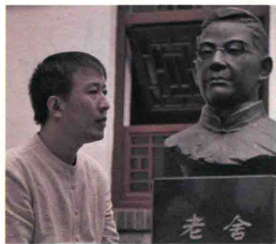
魏新，文化学者，全国青联常委， 央视《百家讲坛》主讲人。