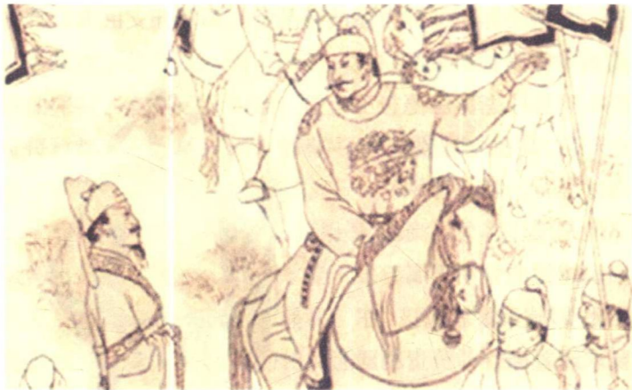
孙伏伽直言谏止唐太宗

根据新、旧唐书的记载，孙伏伽在隋朝大业年间即“补万年县法曹”，唐高祖武德元年因建言献策而擢治书侍御史。王鸿鹏先生等编著的《中国历代文状元》说孙伏伽武德五年（622）因上疏而被免官，同年以免官身份参加科