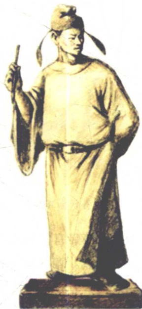
孙伏伽像