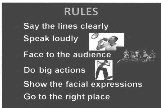
图 1-2 戏剧表演六项标准

邀请有意愿的一组同学上台表演第一幕和第二幕。其他组同学认真观看表演并对照评价标准做出相应的评价。引导同学多做肯定性评价。