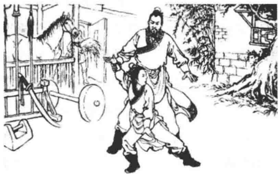
戚继光与父亲戚景通

戚景通老年得子，自然把戚继光当作掌上明珠，但他对儿子的教育却丝毫没有放松。很早他就教戚继光识字读书，练习武艺，还时常给他讲保国安民和为人处世的道理。嘉靖十七年（1538年），也就是