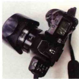
图1-15 Canon EF 35mm f/1.4L USM镜头

摄影师故意城摄影器材使用情况：他的镜头都是交替使用的，室内和街道一般用35mm镜头，其他镜头也一样会用到；相机没什么特定，环境很暗的话就不用胶片了。他说主要还是看个人习惯。