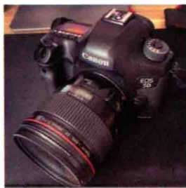
图1-12 Canon EOS 5D Mark III机身