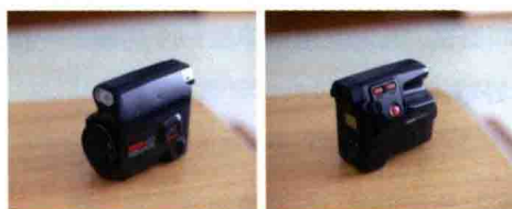
图1-4 Kyocera京瓷武士SAMURAIX 3.0半格相机