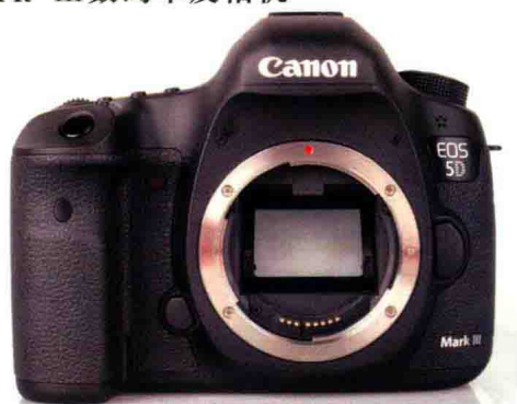
图1-21 Canon EOS 5D Mark III机身

Canon EOS 5D Mark III是一款性能比较全面的全画幅单反相机，最大像素数2340万，拍摄的照片最高分辨率达到了4368×2912，可用感光度ISO3200，有61个自动对焦点和6张/秒的连拍速度。