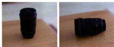
图1-8 Canon EF 135mm f/2L USM镜头