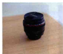
图1-6 Canon EF 50mm f/1.2L USM镜头