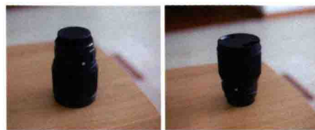
图1-10 SIGMA 85mm f/1.4 DG镜头