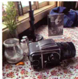
图1-14 Hasselblad 500cm中画幅胶片相机