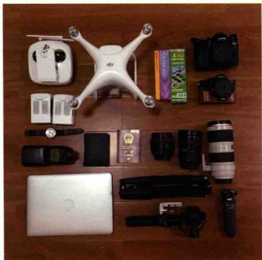
图1-1 摄影师小蔡一壹碟部分装备