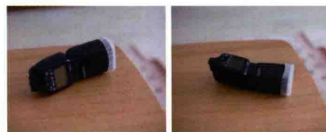
图1-11 Canon 600EX-RT闪光灯