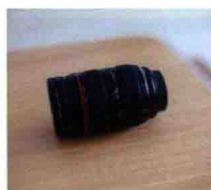
图1-7 Canon EF 24-70mm f/2.8L USM镜头