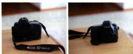
图1-2 Canon EOS 5D Mark III机身