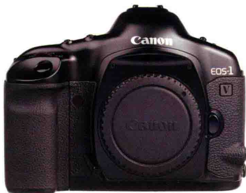
图1-22 Canon EOS-1V机身

Canon EOS-1V是一款全画幅胶片单反相机，使用45点区域自动对焦系统、10张/秒高速连拍、1/8000秒高速快门。