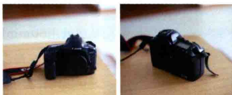
图1-3 Canon EOS-1V机身