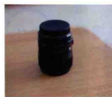
图1-9 镜头Sigma 35mm f/1.4 DG镜头