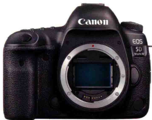
图1-20 Canon EOS 5D Mark IV 机身

Canon EOS 5D Mark IV 数码单反相机是一台搭载3040万像素双核CMOS图像感应器的全画幅单反相机，具备61点高密度网状阵列AF II自动对焦系统和7张每秒高速连拍速度。另外，Canon EOS 5D Mark IV支持最高32000感光度和Wi-Fi直连功能。