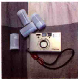
图1-13 Contax T3旁轴胶片相机