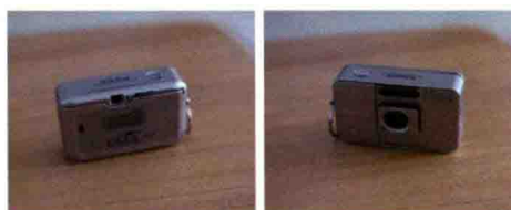
图1-5 Fujifilm Tiara II 胶片相机