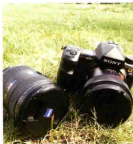
图1-17 摄影师新叶摄影装备