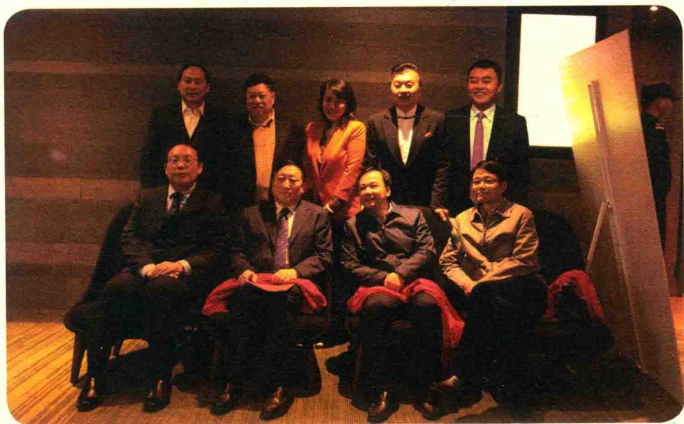
前排右二：何雄 河南濮阳市委书记 前排右一：程志明 河南郑州市市长 前排左一：周喜安 四川资阳市委书记 后排右二：张泽群 中央电视台著名主持人