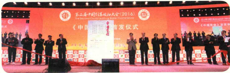
第二届中国创客领袖大会现场，《中国双创》书籍发布仪式

共享的厨房，共享的路演平台，更重要的是，优客工场通过先进的互联网技术和移动互联网技术，为所有企业搭建了一个线上与线下无缝对接的商业社交平台。