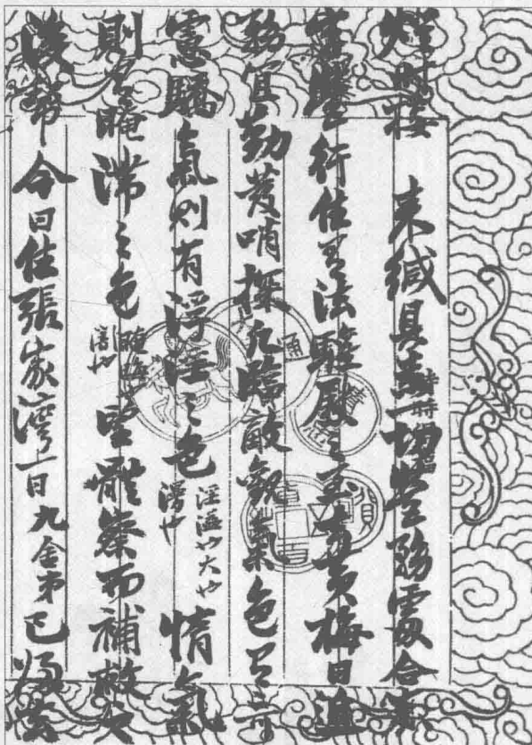
勤发哨探，临敌戒骄气，情气札（之一）