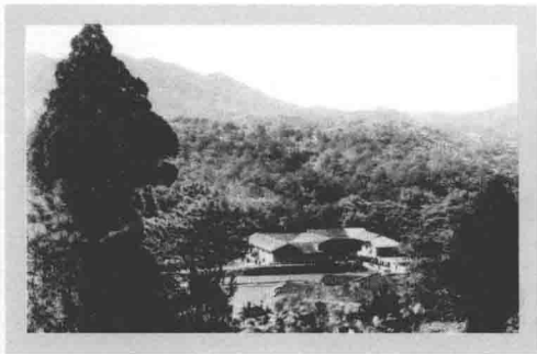
毛泽东故居——湖南省湘潭县韶山冲上屋场。 1893年12月26日，毛泽东诞生在这里。