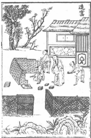
图1 [宋]《墨谱法式》中的制墨流程图