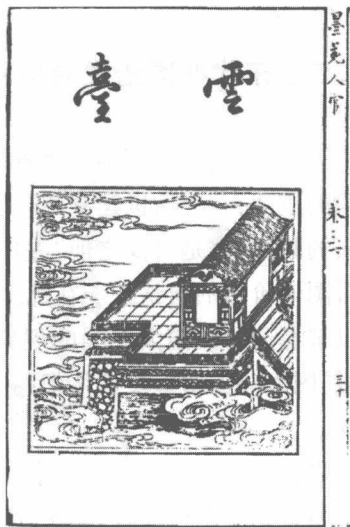
图2 [宋]《程氏墨苑》中的墨块图像

图谱在传统艺术中的应用,不但对本门类艺术的传承、发展至关重要,同时,对艺术影响力与影响范围的扩展也有着不可忽视的作用。一门艺术影响力的扩展程度,往往取决于其所采用的传播手段,而在传播手段中,所采用的传播载体尤为重要。明代中后期出现的一大批刊刻精良的墨谱,将徽州制墨业的发展推上了高峰,其影响一直延续至今。同时,艺术家自身影响力的扩展,有时也要依靠图谱这种载体。如晚明时期,徽州一带以方于鲁、程大约为代表的一批墨商,凭借自己编纂的图谱,在激烈的行业竞争中宣传自己,打压对手,最终成为徽州制墨业的领军人物,不仅被当时的文人所认可,甚至还被推崇为时代文化的领军人物。 ① 一门艺术影响范围的扩展,往往也要借助于图谱的功效。宋代所出现的大量金石图谱,将金石器物的影响广泛传播,其外