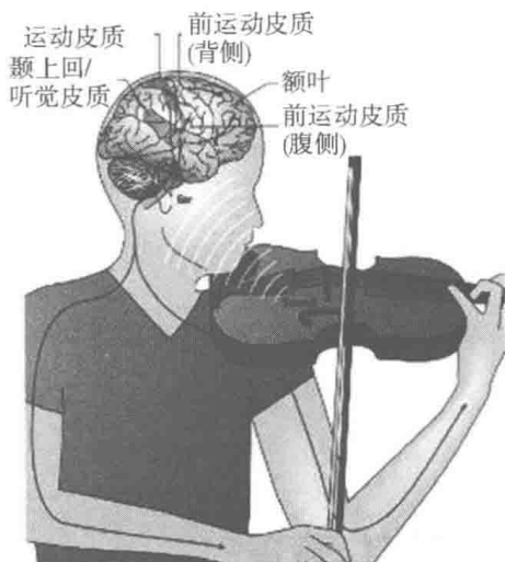
图0-1 参与音乐训练的主要脑区 (Zatorre, Chen, Penhune, 2007)

目前,借助功能性磁共振成像(fMRI)、事件相关电位(ERP)等一系列先进的脑成像技术,研究者们可以在无损伤的条件下,检测出在音乐训练与刺激的影响下,脑功能的活动区域及其激活水平。现有研究主要涉及音乐知觉的神经认知模型、音乐与语言加工的异同、成人与儿童音乐知觉的对比、音乐家与普通人在音乐加工过程中的差异、音乐与情绪的关系以及音乐认知活动的脑机制等方面,并且取得了很多突破性的研究成果。特别是随着教育神经科学的迅猛发展,人们开始尝试通过神经科学、心理学、教育学与音乐学的协同研究,多视角、多层面地分析人在从事音乐活动过程中的脑与心理活动,以求最终达到科学改进音乐教育理论与实践的目的。这些研究深入地探讨了音乐训练和脑结构与功能之间的关系,客观地证实了音乐学习的独特作用。这不仅可以帮助我们更好地探索音乐认知现象的本质,解决一些以往在音乐教育与音乐心理领域无法解答的疑问,而且可以更好地评估、诊断现行的音乐教育领域中的理论与实践问题,这也构成了本书的研究背景。