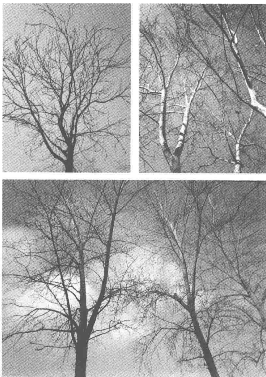
他坐在轮椅上拍的自家门前天上的树。