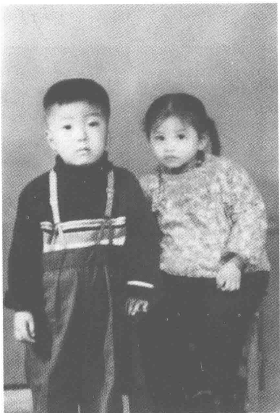
其实他和她相差十岁，这一张是电脑时代的功劳，让他们青梅竹马。（史铁生、陈希米制作）