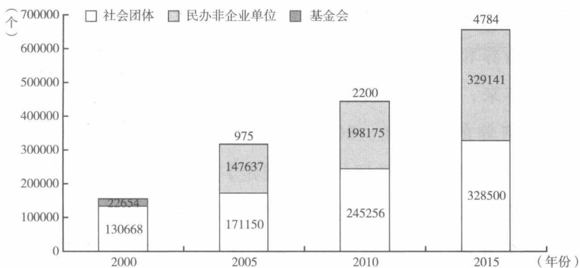
图 1-1 我国社会组织发展趋势