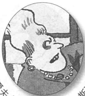
男爵夫人比尔吉塔·冯·斯波