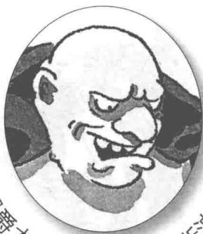
男爵本特-乌维·冯·斯波