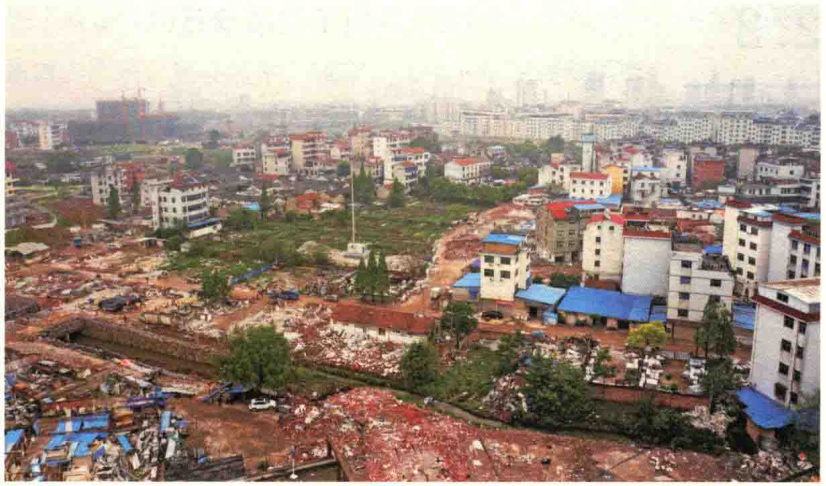
▲ 图2-5 水系被挤压