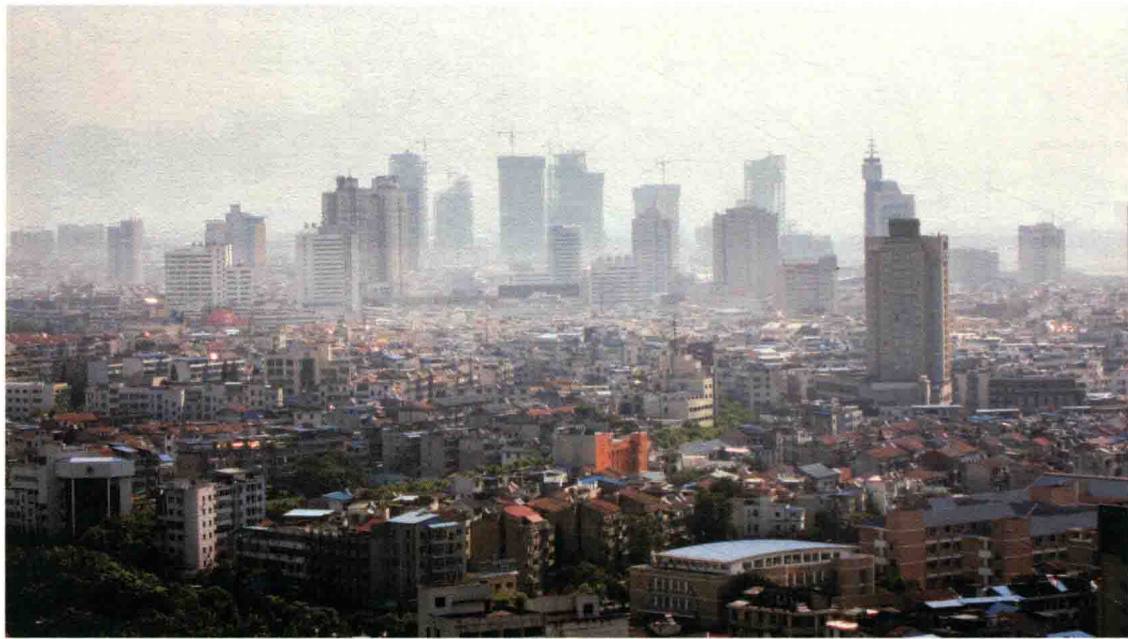
▲ 图2-4 城市不断扩张

山水格局的破坏直接影响到城市的整体环境和品位，城市文化脉络的延续受到极大挑战，也导致城市文化的提升成为无源之水。