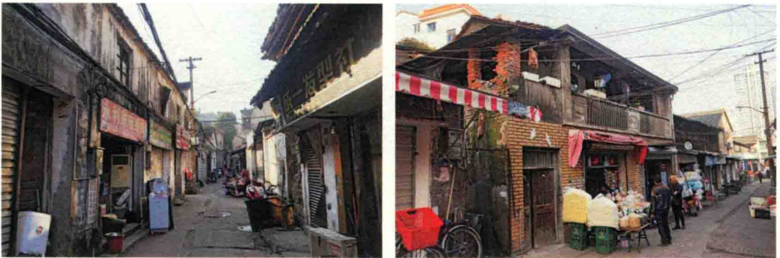
▲ 图2-3 老城区保存现状照片