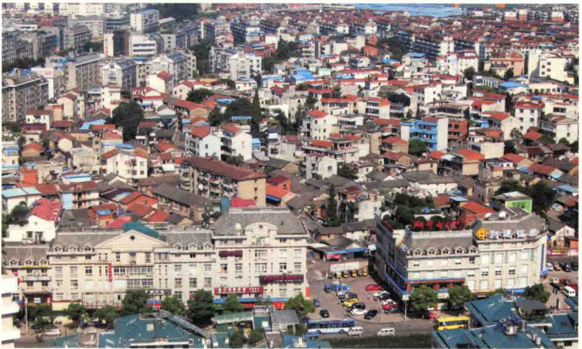
▲ 图2-2 老城区空间现状

义乌城市在商贸业引领、贸工同步推进的产业特征，以及外来人数量远超本地人数量的人口特征主导下，建设规模快速扩张，城市的发展也出现很多问题，在城市形态方面，经分析认为主要存在以下三方面：