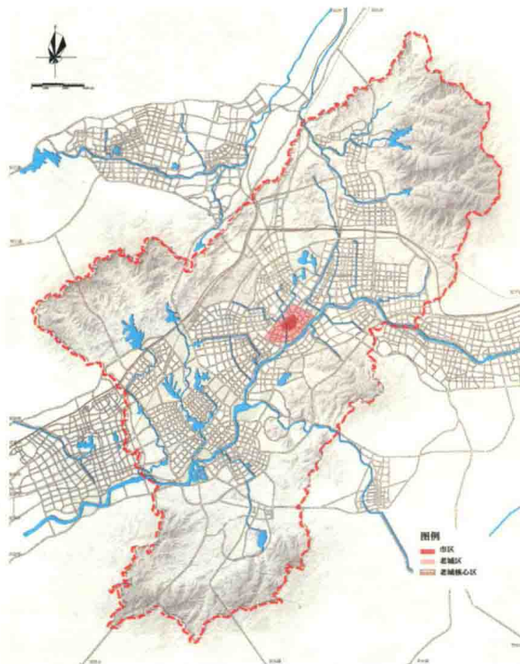
▲ 图2-1 义乌市不同空间层次划分