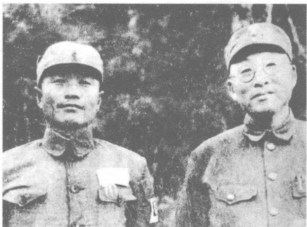
杜聿明（左）与徐庭瑶（右）