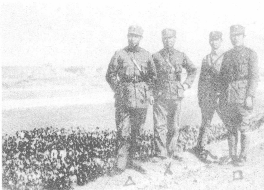
关麟征（左二）、杜聿明（右一）、黄杰（左一）、惠东升（右二）在古北口北山查看地形

第五军军长杜聿明（1904年11月28日—1981年5月7日），字光亭，汉族，陕西米脂县人。毕业于黄埔军校第一期，参加过东征、北伐诸役。1933年，杜聿明在长城抗战时属于第十七军第二十五师，师长关麟征、副师长杜聿明，第十七军军长为徐庭瑶。在作战中，师长关麟征负伤，副师长杜聿明代理，作战英勇。战后，原第十七军军长徐庭瑶被日方要求撤职。杜聿明由于和他的老乡、黄埔一期老同学、师长关麟征不和，于是去中央军校高教班第一期