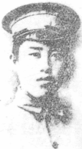
黄埔时期的郑洞国

达枯桃岭、同平、佛子岭一线。补充团团长王文第奉命接替了郑庭笈第三团的600高地。预备队第一团在团长吴啸亚的带领下，在仙女山、老毛岭、大坟岭、大球岭一线占领攻击阵地。在日军顽强的阻击下，荣誉一师攻势受挫，停顿下来。郑洞国总结了进攻不顺的原因，认为攻击正面过宽、兵力薄弱，以致无力确保既得战果。