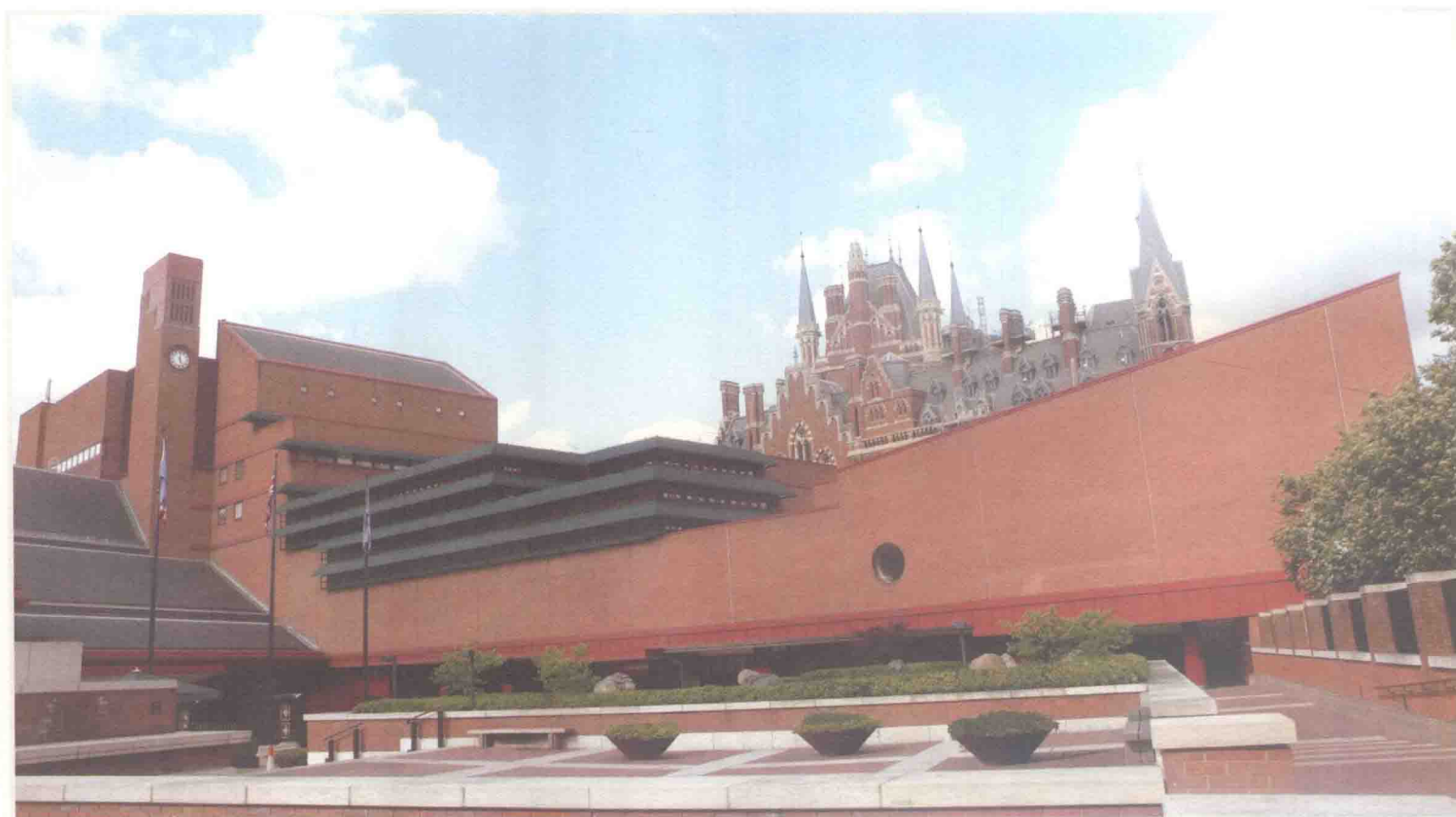
英國國家圖書館 The British Library