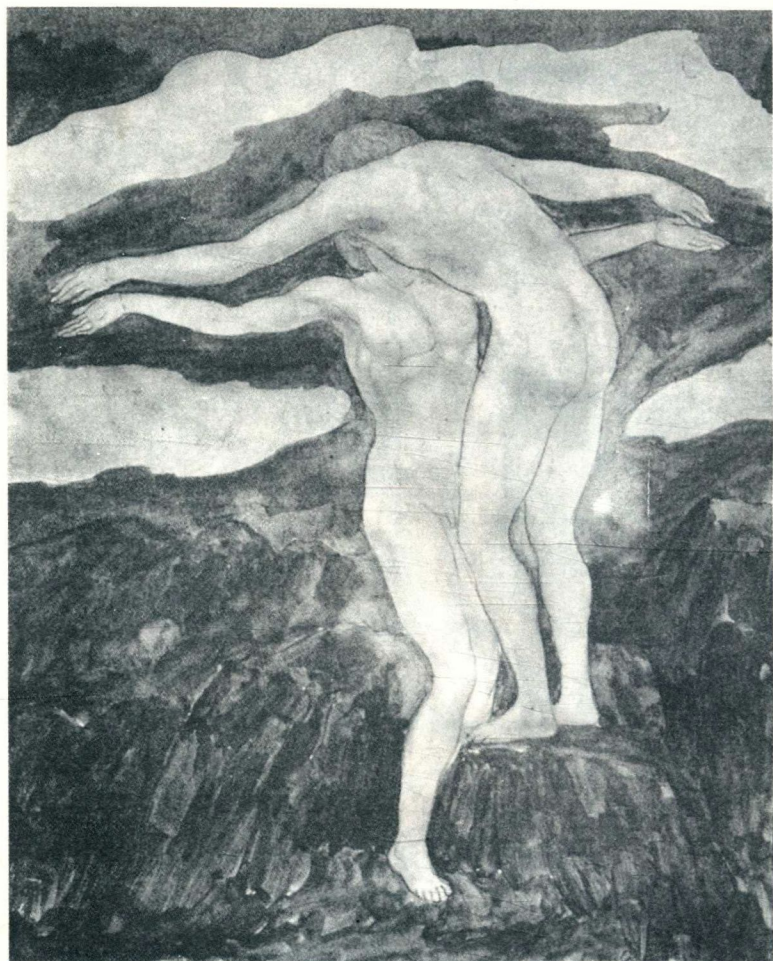
纪伯伦自绘作品插图