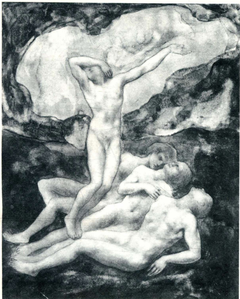
纪伯伦自绘作品插图