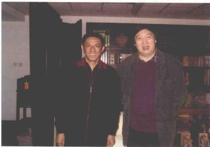
作者与中国文联副主席、著名作家冯骥才合影