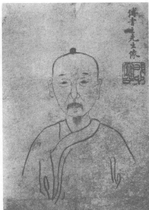
傅山先生五十五岁像