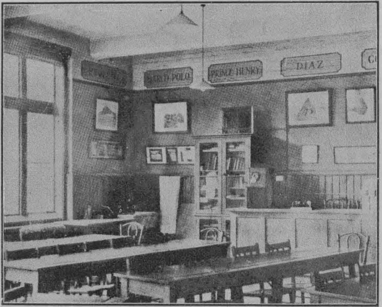
隅西的室教理地校學斯利爾愛廉威