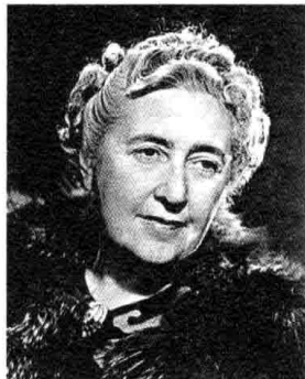
阿加莎·克里斯蒂 Agatha Christie (1890—1976)