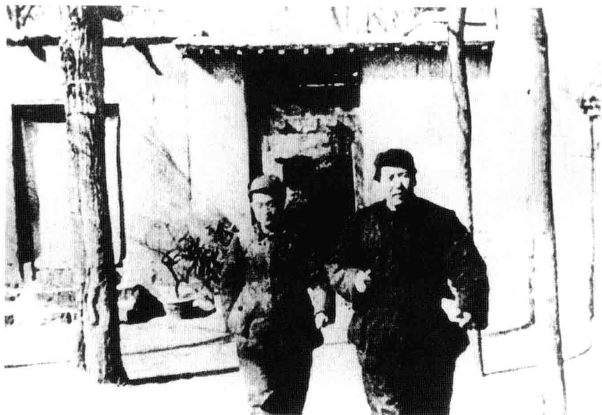
中共七届二中全会期间，毛泽东和胡乔木在一起。