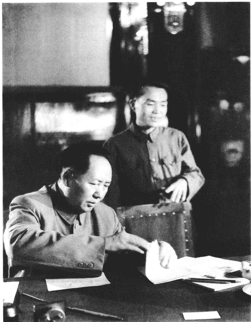
1950年6月29日毛泽东与胡乔木在中央人民政府第八次会议上。