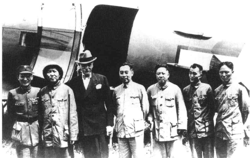
1945年8月毛泽东赴重庆谈判，胡乔木（右二）随同前往。这是在延安机场上的合影。