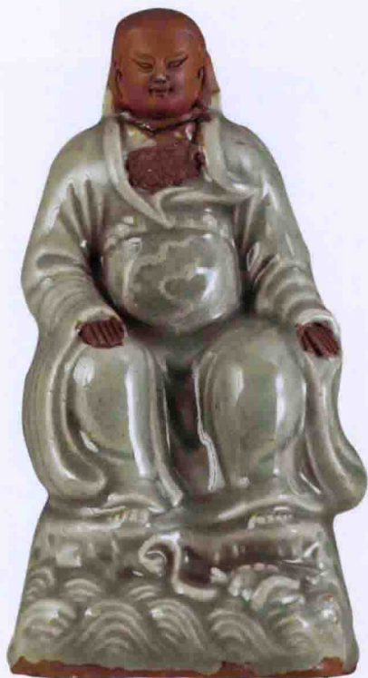
彩图三五 明龙泉窑梅子青釉文昌帝君像(广东省博物馆藏)