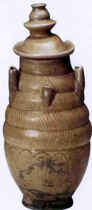
彩图三 北宋龙泉窑青釉多管瓶