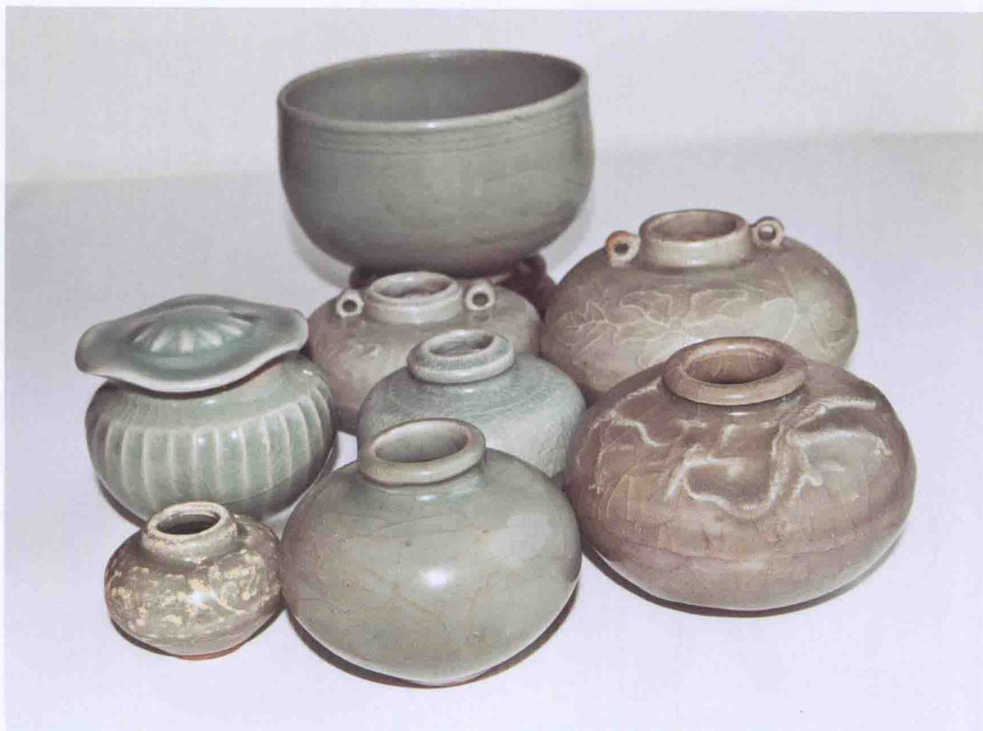
彩图二〇 宋至明龙泉窑青釉双系小罐与钵(印尼出土)