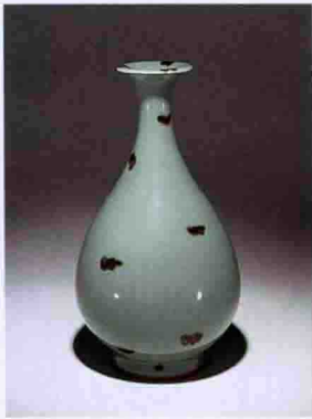
彩图二一 元龙泉窑青釉褐斑玉壶春瓶(日本大阪市立东洋陶瓷美术馆藏)