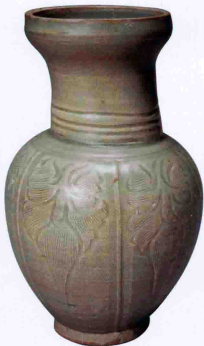
彩图一 北宋龙泉窑青釉盘口瓶(龙泉林祥元丰元年墓出土)