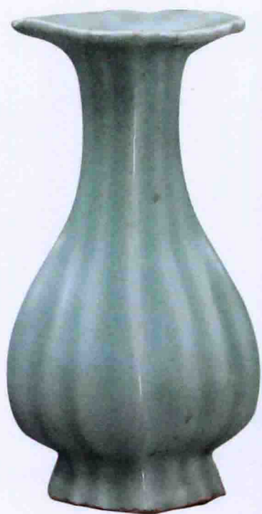
彩图八 南宋龙泉窑青釉瓜棱瓶(金鱼村出土)