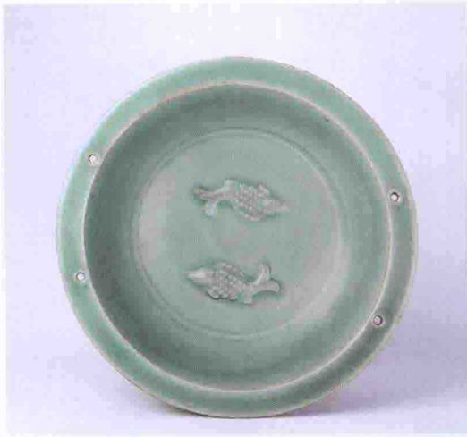
彩图一三 南宋龙泉窑青釉凸雕双鱼纹洗(故宫博物院藏)