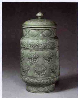
彩图二九 明龙泉窑青釉印花壮罐(故宫博物院藏)