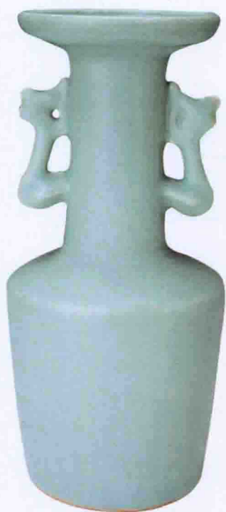
彩图七 南宋龙泉窑青釉凤耳瓶(松阳县博物馆藏)