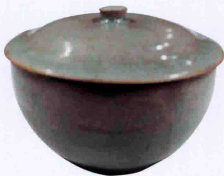
彩图一〇 南宋龙泉窑黑胎青瓷盖碗(上海博物馆藏)