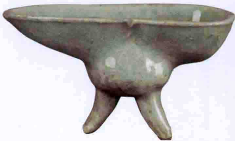
彩图二五 元龙泉窑青釉印花爵杯(广东省博物馆藏)