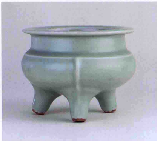
彩图一七 南宋龙泉窑三足炉(故宫博物院藏)