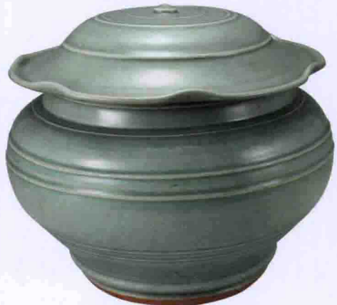
彩图二六 元龙泉窑青釉荷叶盖罐(镇江出土)