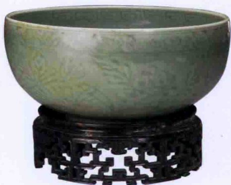
彩图三三 明龙泉窑里外暗花碗(故宫博物院藏)