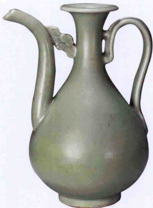
彩图三二 明龙泉窑青釉执壶(故宫博物院藏)