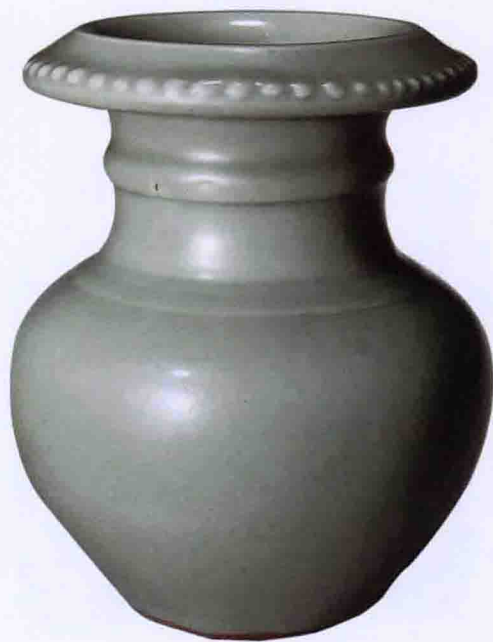
彩图三一 明龙泉窑青釉石榴尊(故宫博物院藏)