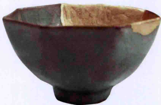
彩图一一 南宋龙泉窑黑胎青瓷八角形杯(上海博物馆藏)