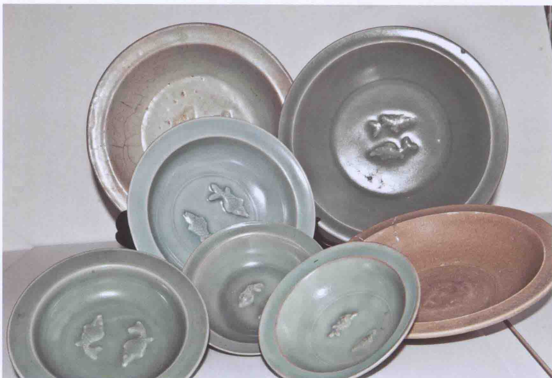
彩图一九 宋至元龙泉窑青釉双鱼纹洗(印尼出土)