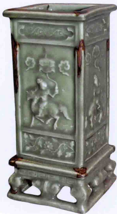
彩图三〇 明龙泉窑青釉印花麒麟送子图方筒瓶(天津博物馆藏)