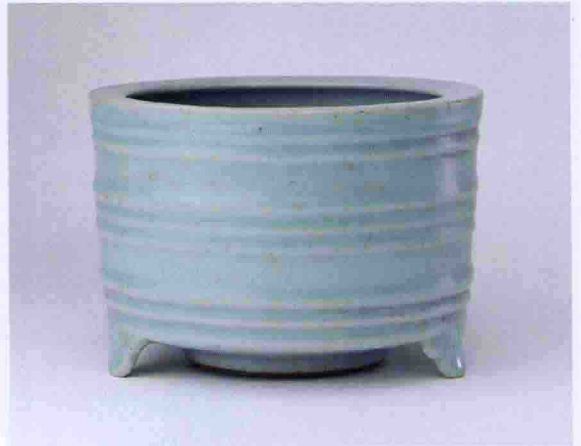
彩图一六 南宋龙泉窑弦纹筒式三足炉(故宫博物院藏)