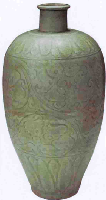
彩图四 北宋龙泉窑青釉瓶(松阳县博物馆藏)