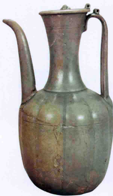
彩图五 北宋龙泉窑青釉瓜棱执壶(云和县文物管理委员会藏)