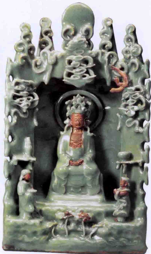
彩图二八 元龙泉窑青釉观音龕(扬州文物商店藏)