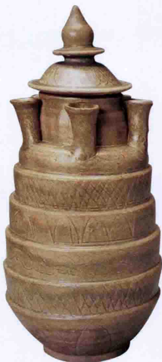
彩图二 北宋龙泉窑青釉多管瓶(龙泉市博物馆藏)