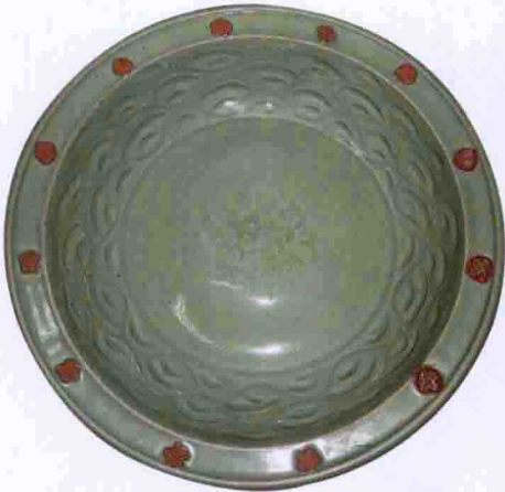
彩图二三 元龙泉窑青釉钵(印尼出土)