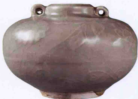
彩图二七 元龙泉窑青釉双系小罐(平潭“大练1号”沉船出水)