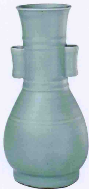
彩图六 南宋龙泉窑贯耳弦纹瓶(故宫博物院藏)