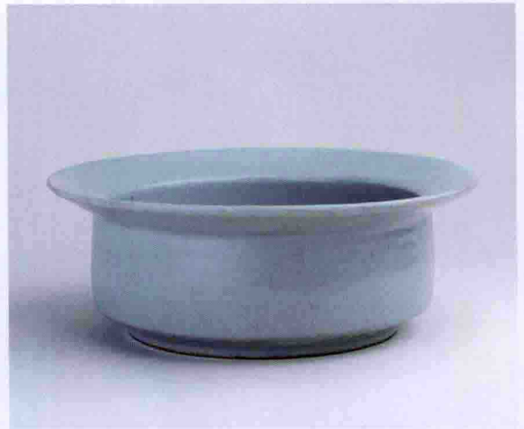
彩图一四 南宋龙泉窑青釉扳沿洗(故宫博物院藏)