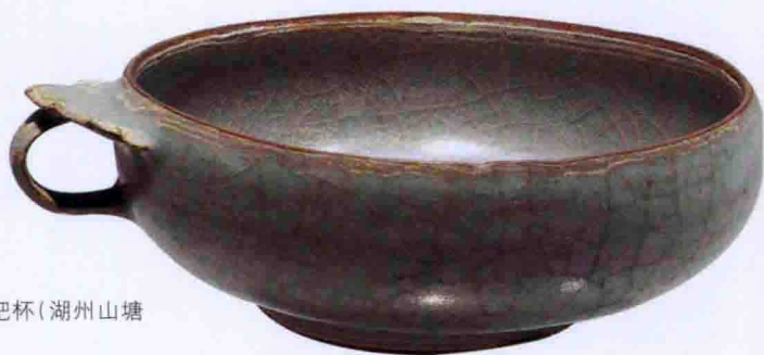
彩图一二 南宋龙泉窑黑胎青瓷把杯(湖州山塘村皇坟山出土, 湖州博物馆藏)