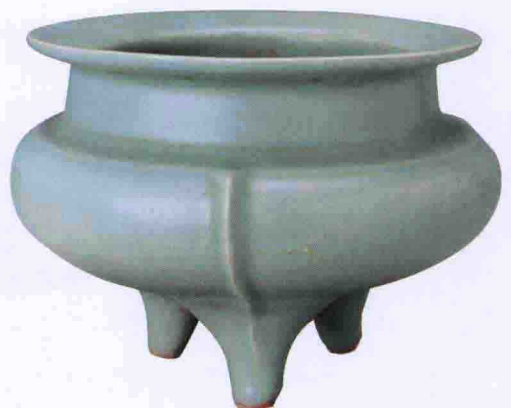
彩图一八 南宋龙泉窑青釉三足炉(故宫博物院藏)