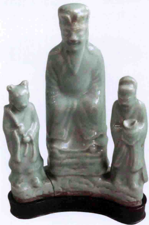
彩图三四 明龙泉窑青釉财神像(北京艺术博物馆藏)