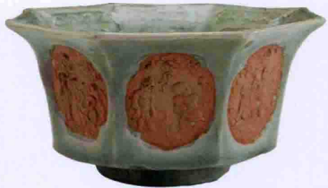
彩图二四 元龙泉窑粉青釉八角印花双鱼纹碗(广东省博物馆藏)