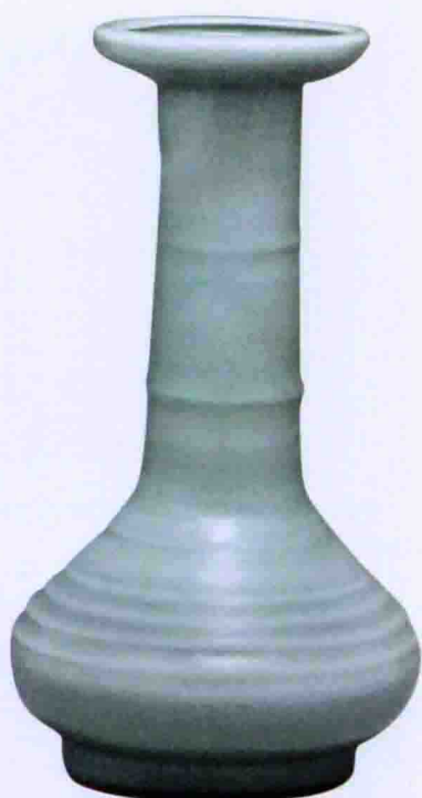
彩图九 南宋龙泉窑青釉弦纹瓶(金鱼村出土)