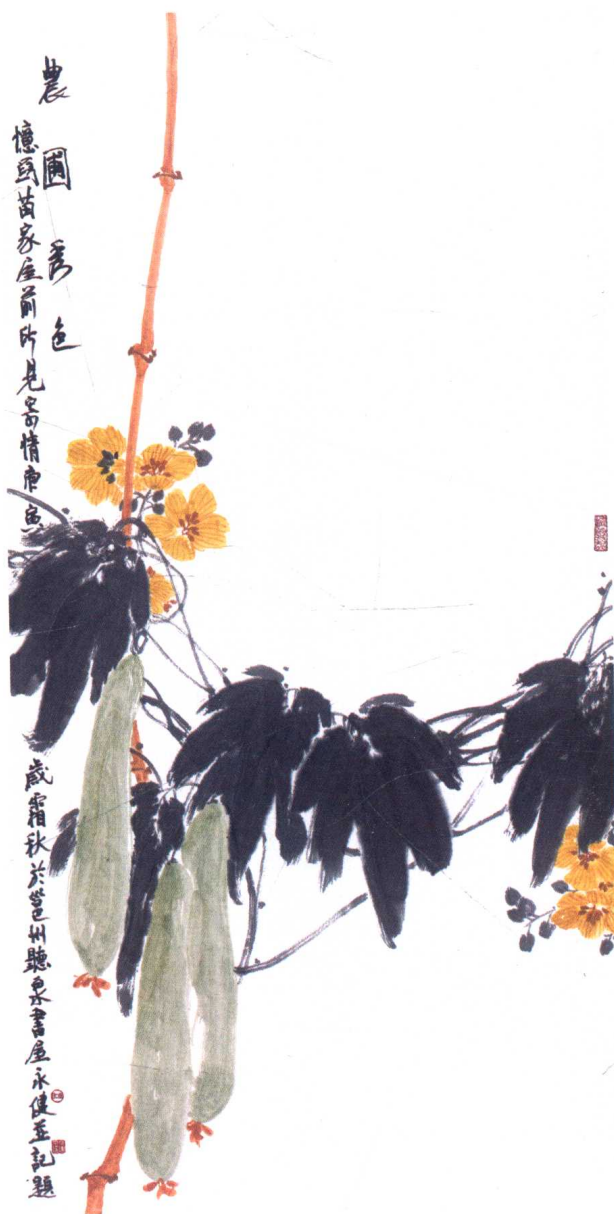
图 17 余永健·《农圃秀色》——传统章法美