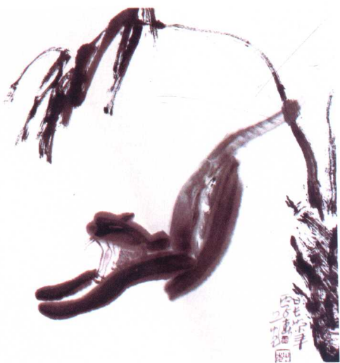
图 16 张之光·《日长如小年》——意象造型美（典型动态、概括）