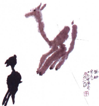
图 15 张之光·《呦呦鹿鸣》——意象造型美（稚拙）