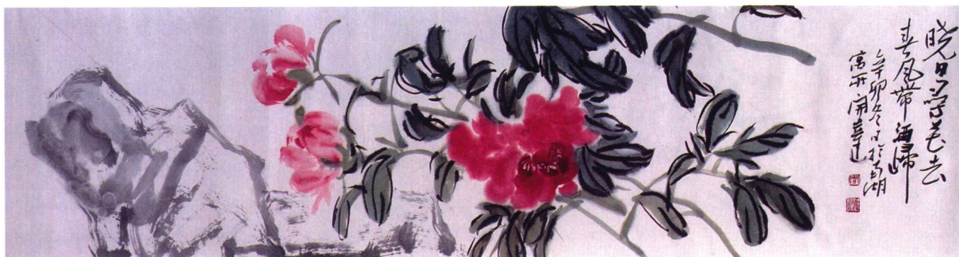
图6 周凯达·《晓日寻芳去 春风带酒归》——简洁、概括，不拘细节

写意画的核心语言要素是“笔墨”，其源于文人书家“以书法演画法”的推动。宋、元时期，将“笔墨”提到了至高的位置，几乎“笔墨即画法，画法即笔墨”，可见笔墨的重要性。笔墨蕴含丰富的情感性并具有相对独立的审美价值，成为最核心的写意画语言，被现代笔迹学所印证。笔迹是鉴别签名者个人身份的最有效证据，因为笔迹的独一无二和不可替代性，加之书法审美的规范性约定，成为写