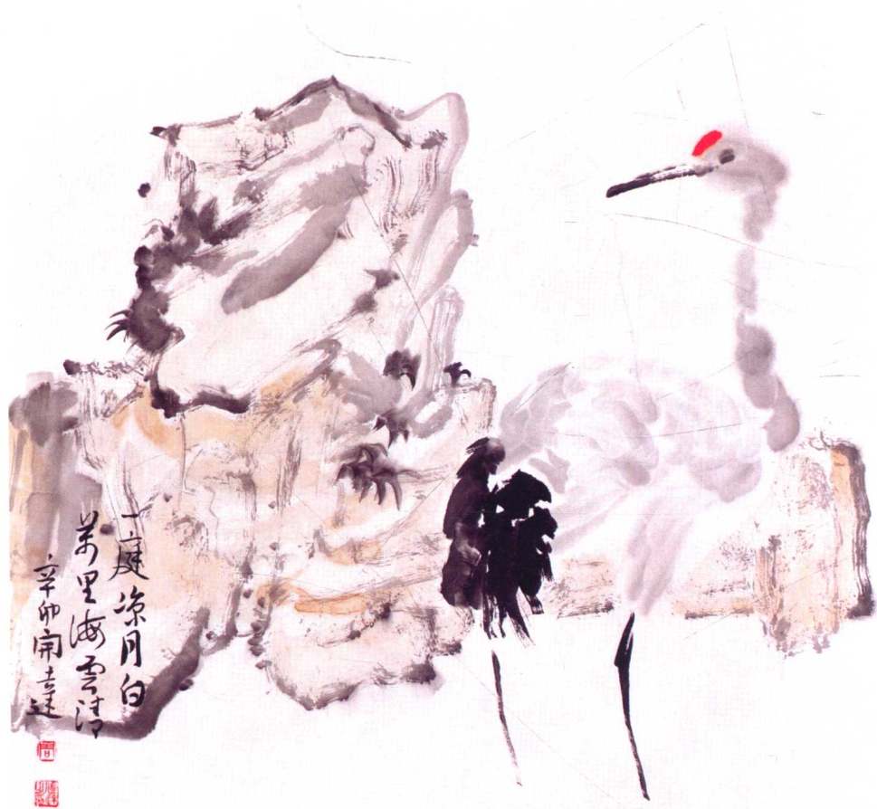
图 11 周凯达·《万里海云清》——诗意境界美