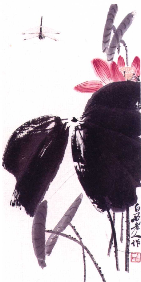
图4 现代·齐白石《晴日》