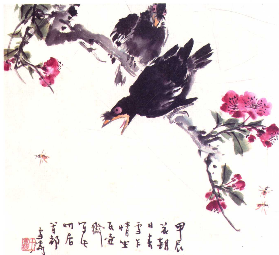
图5 现代·王雪涛《春雪乍晴》