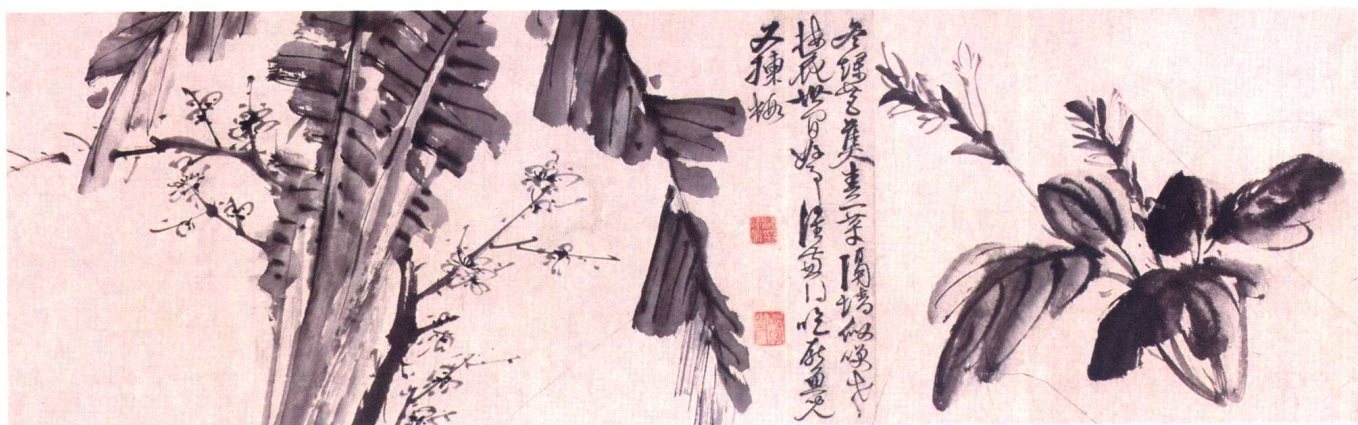
图1 明·徐渭《墨花图册》(局部)