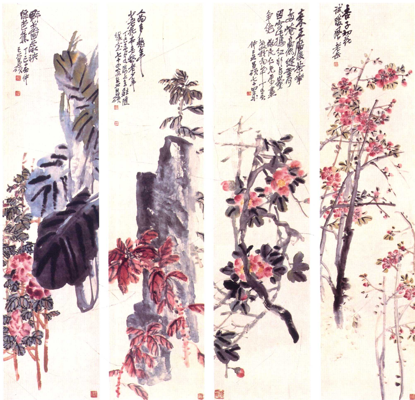
图3 清·吴昌硕《花卉四屏》