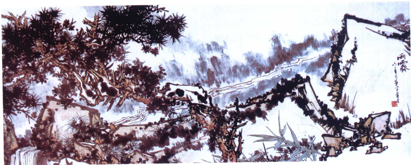
图 14 潘天寿·《雨霁》——儒家的雄强刚健