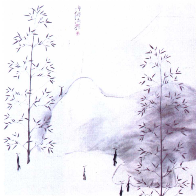
图13 张之光·《解释新篁》——道家的清虚、简静与空灵、自在