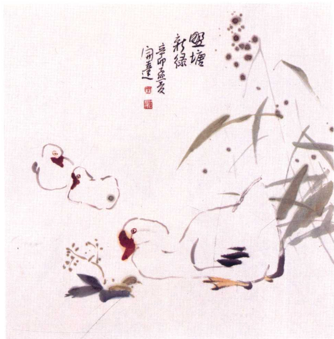
图 10 周凯达·《野塘新绿》——生活情趣美