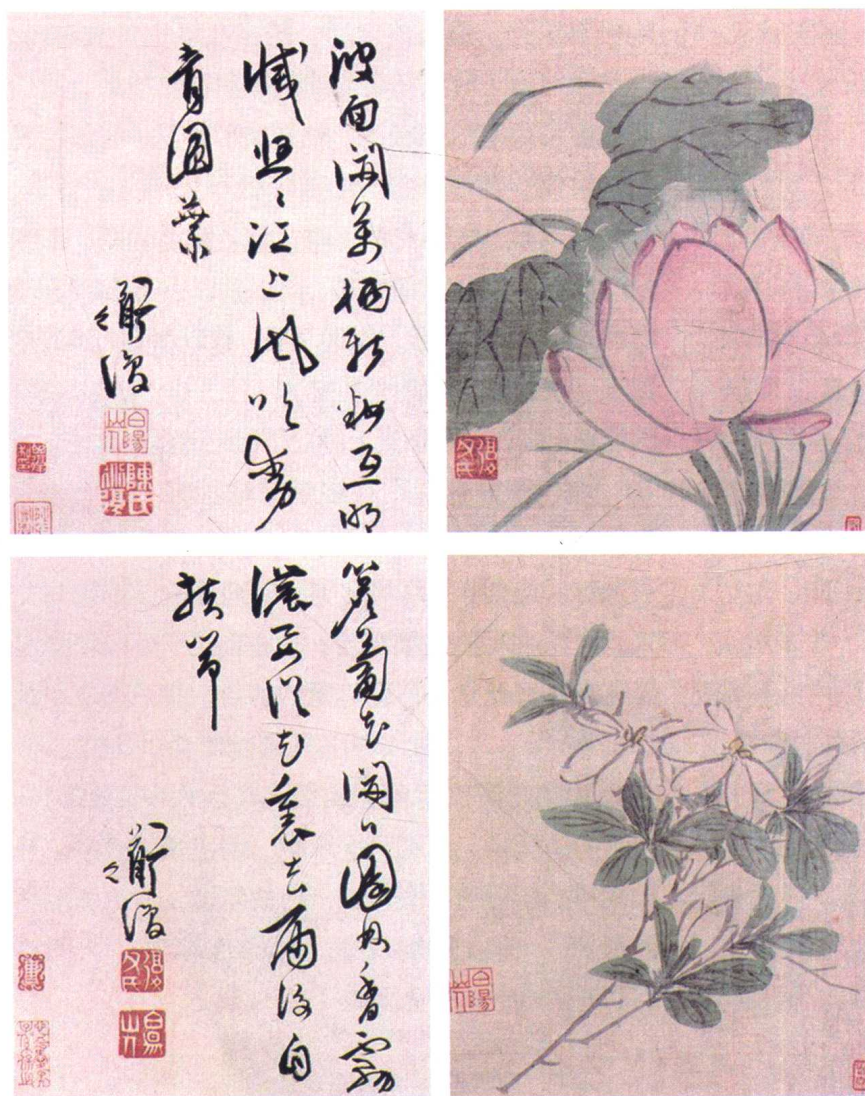
图2 清·陈淳《书画册页》