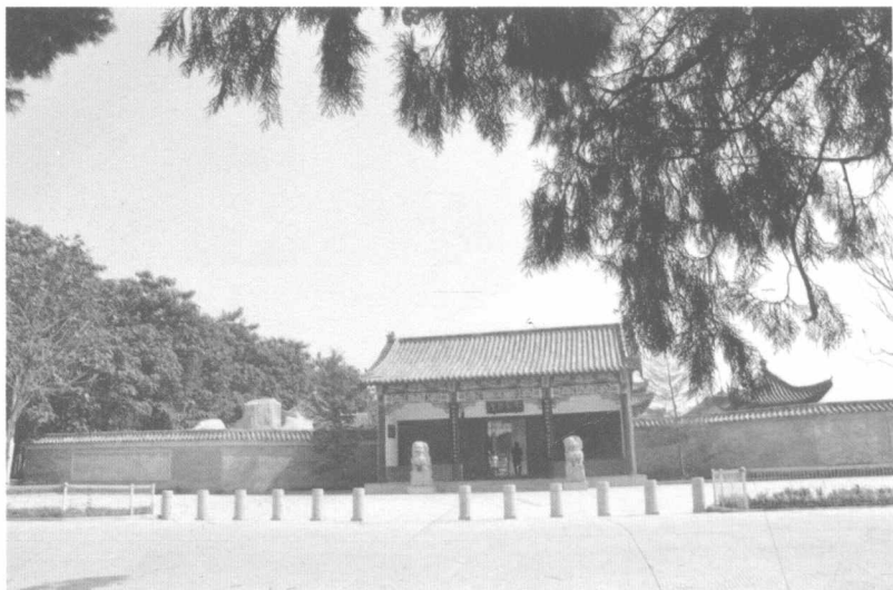
亳州希夷故里陈抟观前山门