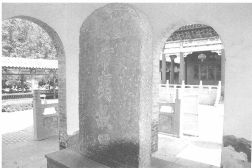
乾隆皇帝推崇陈抟思想，曾御笔“希夷故里”，石碑已毁。这块立于亳州希夷故里的石碑，系光绪五年陈氏家族集资按原貌重刻