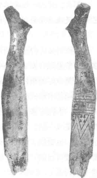
宰丰骨匕记事刻辞

封建社会中，儒家思想居于中华民族思想的主流地位，对汉字书法艺术产生了重大影响。首先，从个体上讲：我们为什么喜欢一门艺术，因为从这门艺术中得到了愉悦和享受；我们为什么喜欢一位艺术家，因为从这位艺术家身上得到了共鸣与思考；我们为什么喜欢一件艺术作品，因为从这件作品上得到了启迪与熏陶；我们为什么喜欢一类艺术风格，因为从这类风格中得到了方向和目标。这是艺术的一个方面，自然、本能的反映。还有另一方面，这就是社会的影响。一个民族创造一种文字，选择一种文字形象，热衷一种艺术形式，这一切完全都是出于民族的精神、意识形态和文化教育的需要，所以我们还不能站在一般的艺术层面来谈书法艺术的个体选择。可以说书法是反映我们民族精神的最高艺术表现形式。