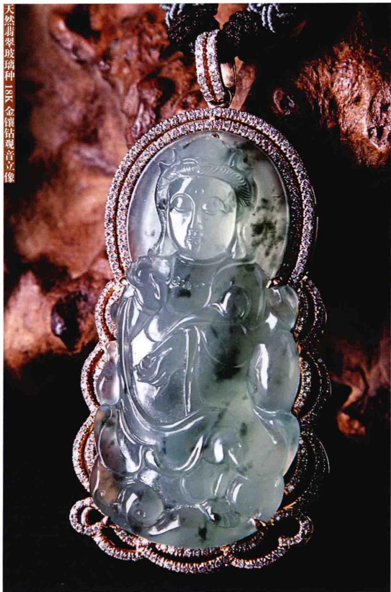
天然翡翠玻璃种 18K 金镶钻观音立像