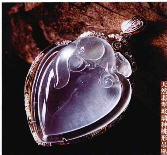
天然翡翠玻璃种桃形吊坠