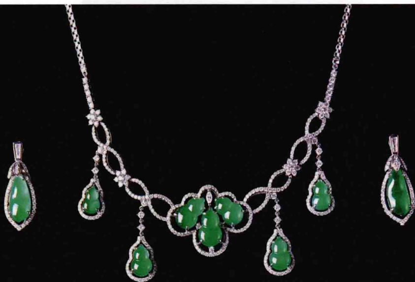
翡翠玻璃种满绿葫芦套装

据史料记述，清乾隆初年恢复了缅甸通道，进一步促进了两国玉文化和翡翠文化的交流。同时，中国的玉雕工艺技术也传入了缅甸。经历了三百多年，翡翠在中国民间也大为普及，而云南腾冲的翡翠雕琢业也兴旺起来，中国的翡翠文化也获得了蓬勃发展。