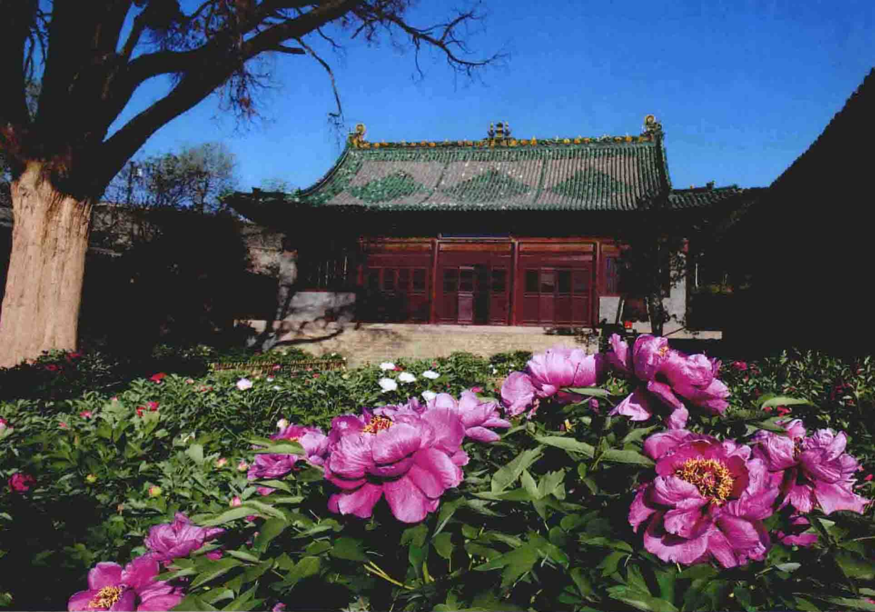
上图为奉圣寺，下图为圣母殿、鱼沼飞梁