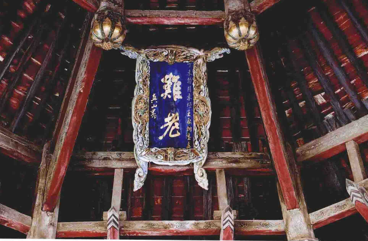
上图为难老泉亭匾额，下图为唐碑亭