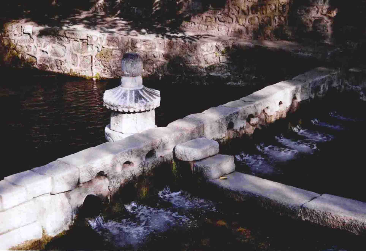
上图为张郎塔，下图为水镜台