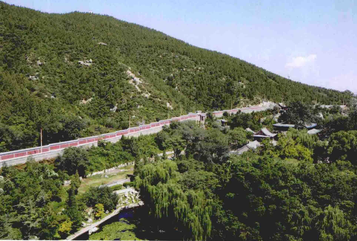
上图为悬瓮山，下图为周柏